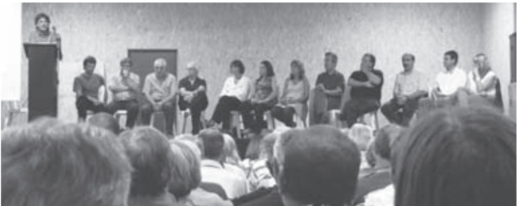
L'alcalde i els dotze regidors a Les Faixes, el 29 de juliol