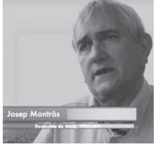
Dos fotogrames de la pel·lícula