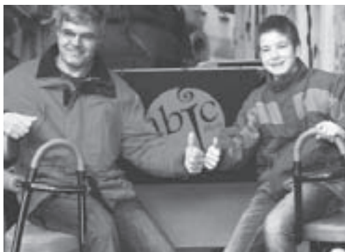
Els guanyadors dalt del carro

El dissabte 21 de gener, entre les deu del matí i la una del migdia, els guanyadors de la campanya promocional de l'Agrupament de Botiguers i Comerciants de Moià es van haver de gastar l'import dels premis de la campanya natalenca en alguns dels diferents establiments associats.