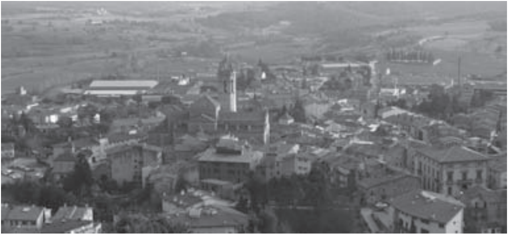
Moià a mitjan febrer

23 de gener, quan sabien que fins a finals de mes no se signava aquesta venda. Per tant, a diferència del que diuen, jo no estic incomplint res. No és culpa meva que la Generalitat es demorés.