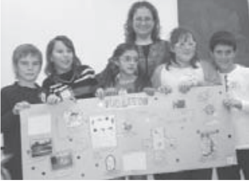
A. Baró amb alguns alumnes

Des del novembre fins al gener, els alumnes de quart de primària de l'Escola Josep Orriols i Roca han realitzat la «webquest» Els Eskamots i les deixalles .