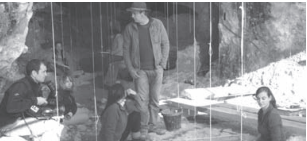
Enregistrament del programa Sota Terra

Les Coves del Toll patrocinen el bàsquet infantil de Moià: Per tercer any consecutiu, el Museu de Moià i les Coves del Toll patrocinen amb l'equipament de suport els nois i noies del bàsquet de Moià, Benjamí-11. D'aquesta manera, en els seus desplaçaments pel Bages, l'equip fa difusió de les Coves del Toll. El Museu també col·labora amb els obsequis oferts a tots els equips de la Catalunya Central que participen en la jornada que té lloc al Pavelló de Moià.