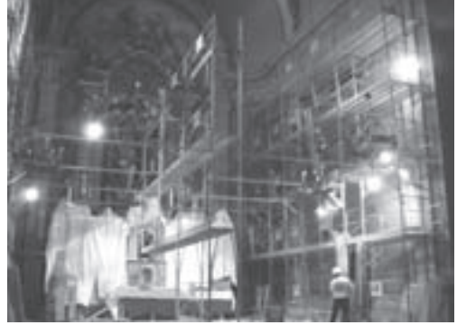
Muntatge de les bastides

A finals de gener van començar els treballs per a renovar la pintura del presbiteri de l'església, bastant malmesa pel pas dels anys, amb el muntatge d'una gran bastida que ocupa tot el presbiteri i que permet d'arribar fins a la volta, a uns vint metres d'alçada. Una vegada s'ha pogut veure de prop tota la superfície, s'ha apreciat que la principal afectació era la brutícia i l'envelliment de la pintura.