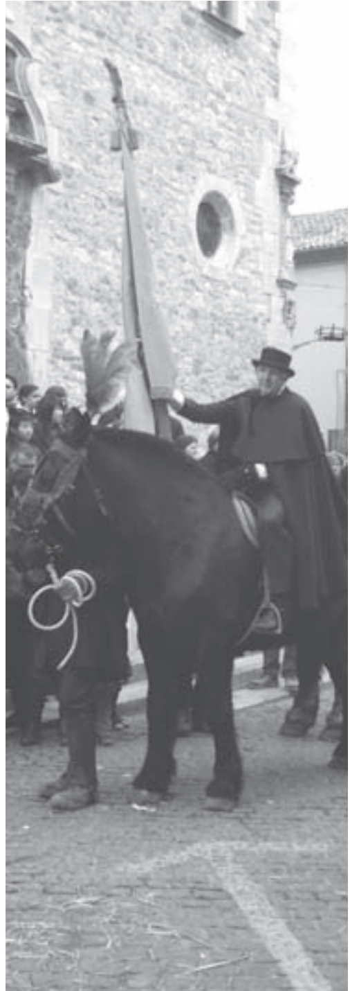
Els Tres Tombs

El dissabte següent, a la tarda, se renata a càrrec dels Grallers de Moià a casa de cada un dels administradors d'enguany (M. Àngels Morera i Barniol,