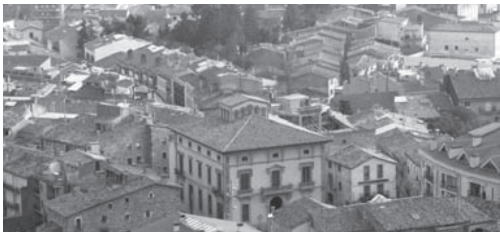
Detall de Mojà a mitjan febrer