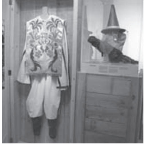
El Pollo de Moià exposat

L'exposició, titulada «Capgrossos, Pignes i Berrugues», ha estat produïda pels ajuntaments de Figueres, Olot i Vic, municipis per on passarà la mostra. És la primera vegada que es poden veure junts en una mostra itinerant aquests personatges de la faràndula. El Pollo