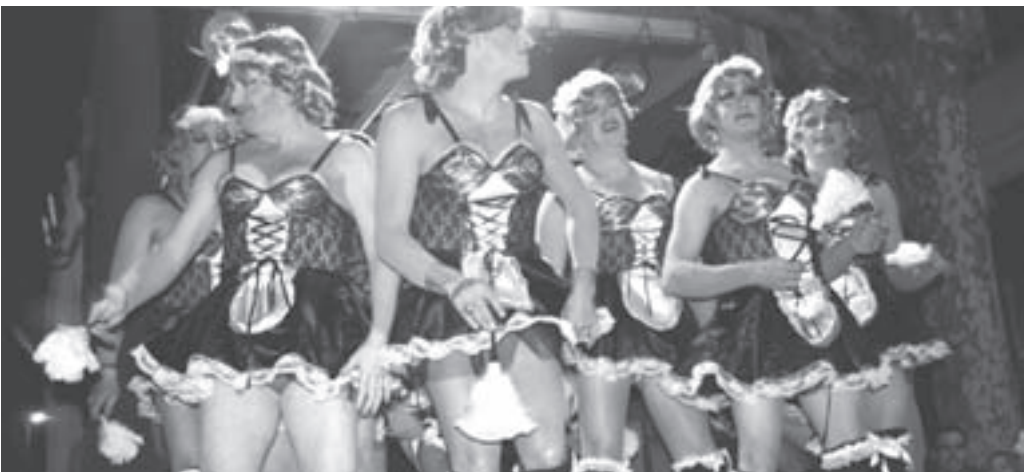
El rei Carnestoltes amb el seu seguici i dues comparses de la rua