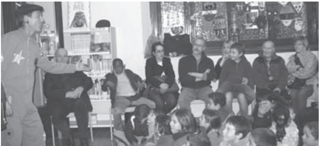
Contes africans a la biblioteca

Des d'aquí volem donar les gràcies a totes les persones que esteu fent possible aquesta campanya, ja sigui amb la vostra implicació o amb la vostra presència i participació en les activitats que estem duent a terme fins al dia 3 de juny, data en què, entre tots, escollirem el projecte al qual destinarem els diners recaptats.