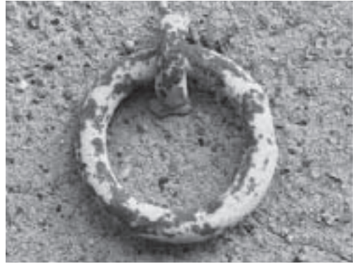
Anella de cal Daies

Cap a casa, o no. Ella potser anirà a visitar algun familiar, que li posarà un plat a taula i amb qui passarà la tarda