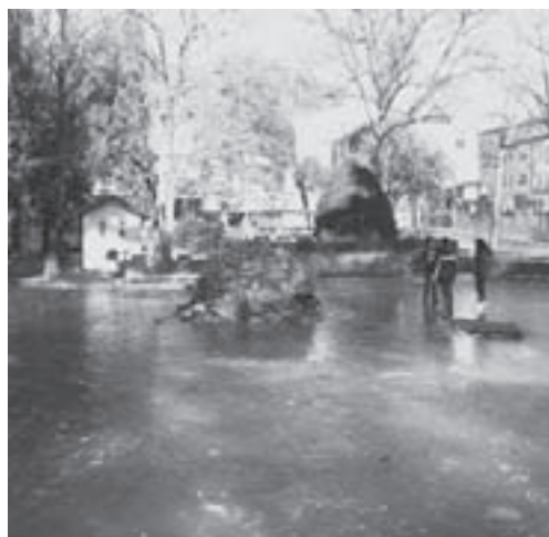
L'estanyol del parc, gelat

Al cicle de fred i neu que va alterar la vida quotidiana al Moianès a inicis de febrer, s'hi va afegir un episodi d'intens vent la nit del 6 al 7 de febrer. A l'Estany el vent causà molts desperfectes a les teulades i especialment en les xemeneies de les cases.