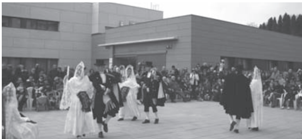
Ball del ciri en la nova plaça del CAP

El dimecres 17 al matí, a l'església parroquial, missa solemne en honor de