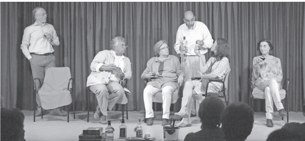
Un instant de la representació

És de desitjar que no s'acompleixi l'anunci de l'adéu de La Cadira.