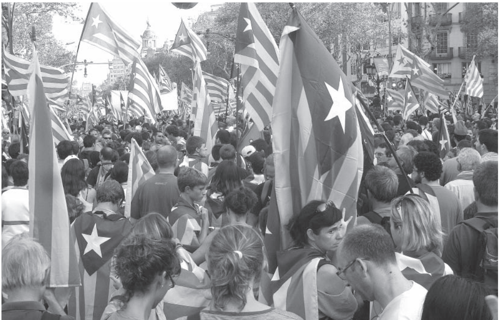
Manifestació per la independència a Barcelona

Estem escrivint la Història del nostre País. Ens hi vols ajudar?