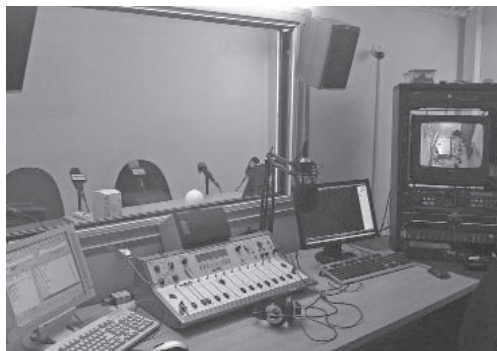
Estudi de Ràdio Moià

Ràdio Moià ha presentat la programació per a la temporada 2012-2013, que ve marcada pel continuisme respecte a la precedent. Així, en l'eix principal es mantenen programes com «Xiu xiu», «La jornada», «Què t'anava a dir?», «Temàtik», «Balles o estudis 2.0» i «Les meves anyorances musicals».