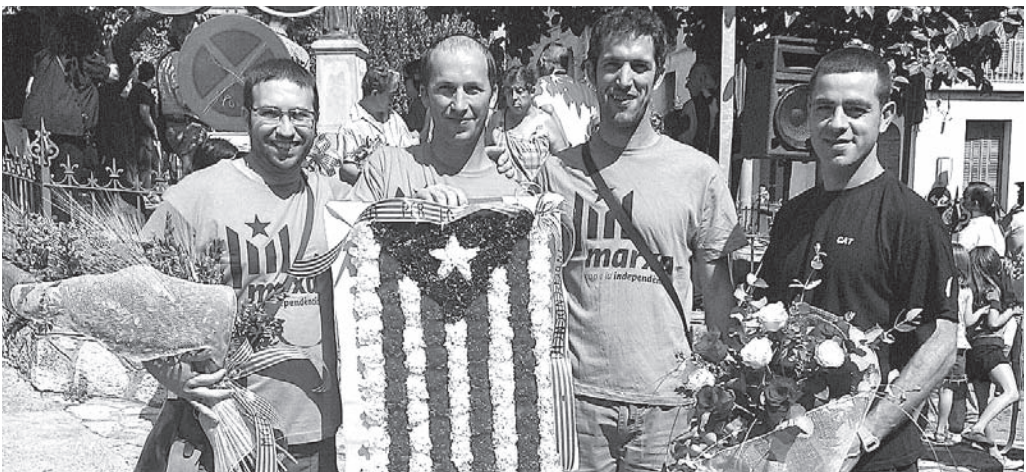
Ofrena floral de l'Assemblea

Per acabar, volem remarcar la importantíssima resposta popular que hem tingut amb les parades informatives: s'han venut moltes samarretes i mocadors, hem recollit noves adhesions, però sobretot ha estat espectacular la venda de centenars i centenars d'estelades de tota mena. Tot això ens ha ajudat molt en el nostre propòsit de socialitzar la independència, parlar-ne, escoltar els dubtes i les reflexions dels vilatans.