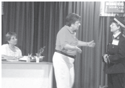
Actuació de les Dones de Caldes

Algunes de les activitats dels mesos de setembre i octubre: