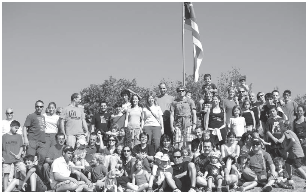
Assistents a l'enlairament de l'estelada al Grony