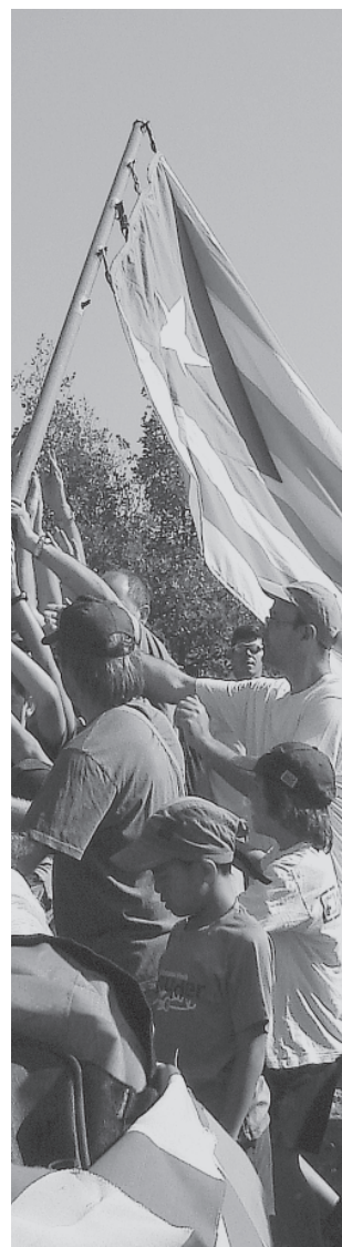
Estelada al Grony

LA TOSCA Can Carner. Joies, 11-13 - 08180 Moià · tel. 938 207 600 · latosca@latosca.org · www.latosca.org