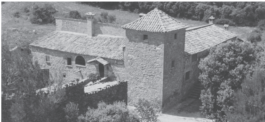
El conjunt de Vilarassau

Tirant avall, en direcció a Avinyó, passada la masia anomenada Armenteres, hi ha Sant Joan Vell, església d'estil romànic, però està tota ensorrada.