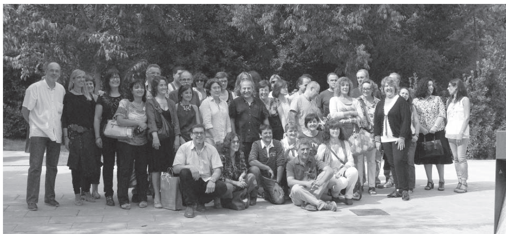
Participants en la trobada dels cinquantins i cinquantines

A la tarda, s'havia reservat el Tosca, a Moia, per a continuar amb la celebració. Pastís d'aniversari, cava i la música que ens agrada, que és la bona! A més de ballar, vam tenir temps d'explicar-nos moltes experiències, perquè ara ja es pot dir que n'hem passades unes quantes, i també els nostres projectes, perquè s'ha de dir tot: encara tenim corda per a estona!