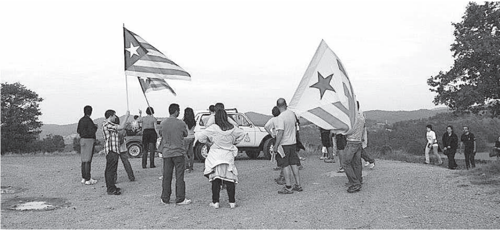
Al puig de la Caritat, abans de la baixada de torxes

El dia 8 de setembre, festa de la Mare de Déu de l'Estany, missa solemne; a la sortida, gegants i sardanes amb la cobla Ciutat de Manresa, pregó a càrrec de Mn. Jaume Casamitjana; a la tarda, concert de Festa Major, i a la nit, ball amb De Gala.