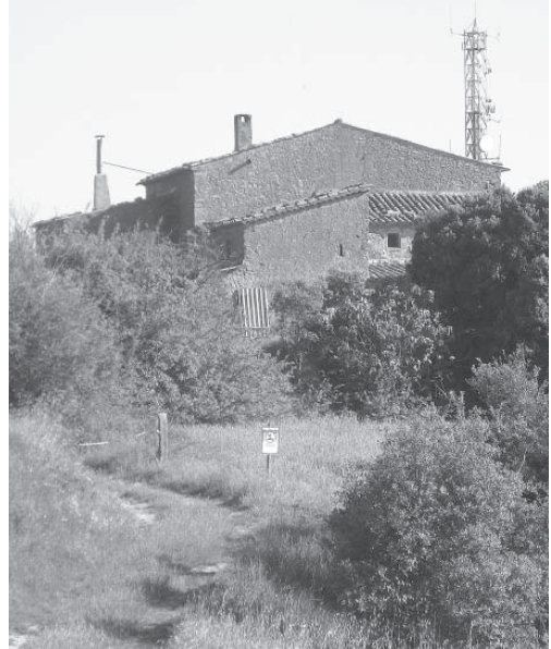
El Salamó

A mig camí de Sant Llorenç, podem veure les construccions de Sant Feliu de Vallcàrcara a baix, en direcció sud-oest. Nosaltres no hi anem, sinó que prenem el camí que va pujant a poc a poc fent giragonses. Vam veure a prop la masia anomenada la Païssa, que ens quedà a l'esquerra. Vam girar a la dreta i continuàrem pujant fins a trobar una cadena. Al davant, un xic enlairades, hi ha unes antenes. Vam passar la cadena i, seguint pel camí més fressat, arribàrem fins a prop de la casa del Salamó. La vam deixar a l'esquerra, seguint camí uns cent metres baixant una mica i girant a l'esquerra per un camí poc fressat. A poques passes vam veure una taula i al costat la font del Salamó. Allà vam esmorzar i tinguérem ocasió de tastar unes quantes maduixes bosca-