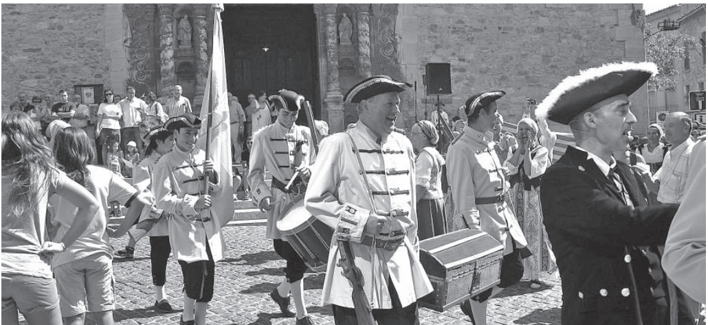
Les tropes franceses

La novetat d'aquesta edició ha estat la projecció, el dissabte a la nit a l'Auditori de Sant Josep, de la pel·lícula El general Moragues, l'heroi oblidat . Es tracta d'un documental promogut per l'Ajuntament de Sant Hilari Sacalm sobre el militar Josep Moragues (1669-1713), fill d'aquesta població, que durant la guerra de Successió tingué un paper important en la defensa del país, fins a la seva captura pels felipis-