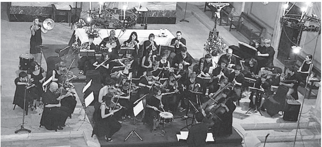
Actuació a l'església de Moià

Des del 2011, l'OC és ja una associació legalment constituïda i s'organitza a partir de comissions. El que en un principi havia estat responsabilitat única del director, ara ha evolucionat cap a la participació i la corresponsabilitat. La comissió pedagògica vetlla perquè el projecte sigui una experiència enriquidora per als participants; la comissió de repertori proposa què és el que s'interpretarà en la pròxima edició, i la comissió de comunicació manté el blog i fa la difusió. La junta directiva, òrgan gestor entre assemblees, ja ha començat a treballar en la sisena edició del concert d'estiu. Tothom hi és convidat.