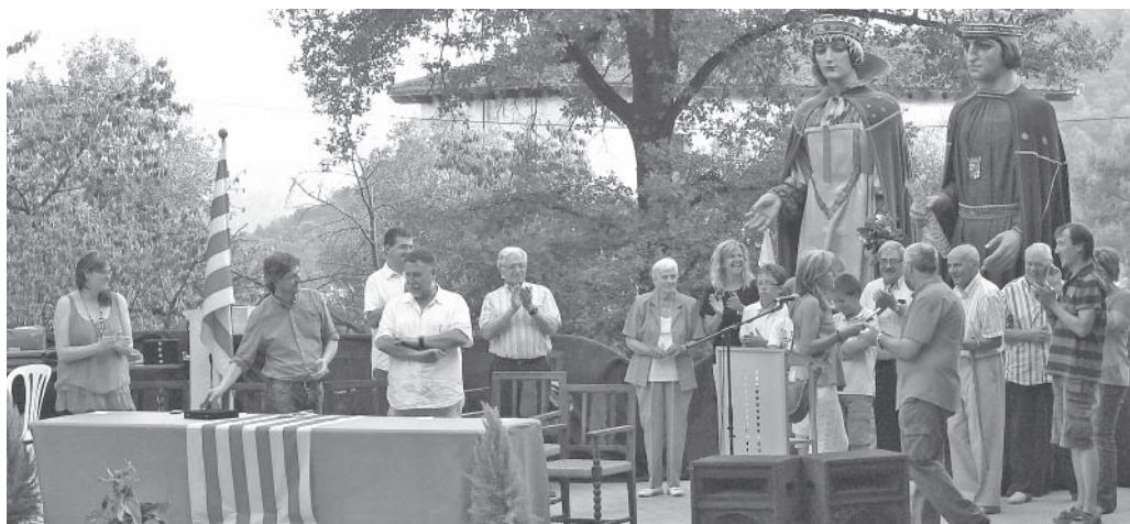
Lliurament del premi a Units per la Fam

Ara només ens resta felicitar-vos a tots. Fins a la pròxima campanya!