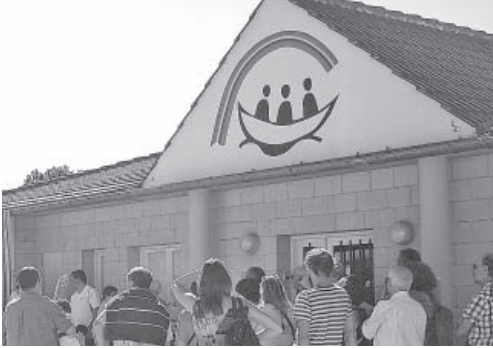
Entrada a la llar

El dissabte 15 de setembre tingué lloc la inauguració de la llar La Nova Olivera, una remodelació de l'equipament ja existent des de l'any 1992. Ara s'ha rehabilitat la part de baix de l'edifici per a adequar-la a taller ocupacional, mentre que la part de dalt s'ha destinat a llar, en substitució de l'existent a la plaça de la Comunitat de Preveres.