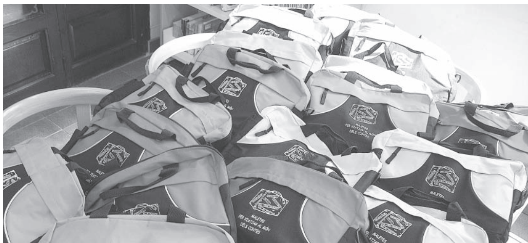
Maletes viatgeres

I per als més menuts, els qui encara no llegeixen, de 0 a 5 anys, ja hem posat a la seva disposició les maletes viatgeres que fem des de la biblioteca per a les escoles. Una trentena de maletes (dues per aula) amb set contes dins de cadascuna, un per a cada dia de la setmana, que van itinerant per totes les llars dels més menuts a fi de començar a assaborir el gust de la lectura, en aquest cas acompanyats pels pares.