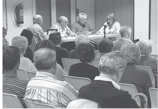
Assemblea general

El dia 29 de setembre va ser un dia plujós i l'agenda força atapeïda no ens hi acompanyava, però tanmateix estem contents de la participació en l'assemblea general extraordinària de l'Hospital-Residència Vila de Moià.