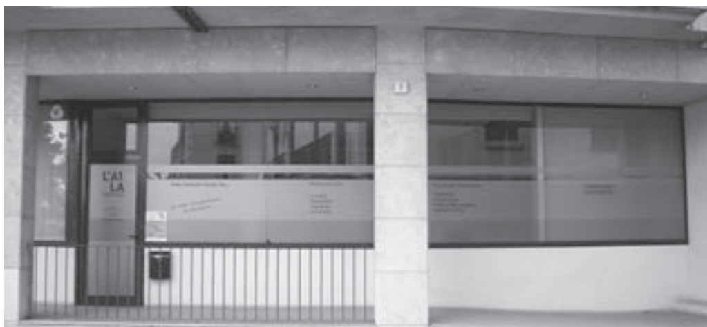
L'A1LA, a la plaça de Sant Sebastià

Aula d'Estudis Xavier Riu, l'A1LA, té com a objectiu i principal raó de ser dotar Moià i la comarca del Moianès d'uns ensenyaments de qualitat, sempre procurant que els alumnes millorin el seu nivell i els seus coneixements, amb l'objectiu de treure millor rendiment escolar o professional, així com superar els seus reptes formatius i aconseguir els seus objectius. L'A1LA sempre està oberta a adaptar-se a les necessitats formatives dels seus alumnes.