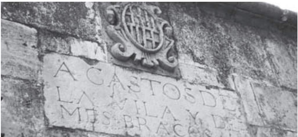
Inscripció i escut municipal a la font vella

Algú pot pensar: a què treu cap tota aquesta perorata sobre les plantes i l'excés de purins d'Osona? Doncs, per si algú no ho ha entès, vol dir que, si finalment es tanquen les plantes, quasi tot aquest immens excés de purins anirà a parar, sens dubte, a les comarques veïnes, i nosaltres en som una, i no pas la menys important ni la menys assequible. La demanda de