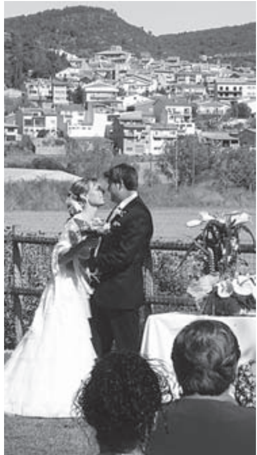
Casament a Vila-rasa

La notícia de La Vanguardia feia esment d'un fenomen sorprenent. Moltes parelles angleses escullen Catalunya per a celebrar-hi el casament. I no vénen soles, és clar. Els anglesos són conscients de tenir més garanties d'un dia assolellat, i demanen uns serveis i un entorn que els sembla de qualitat i més econòmic que a Anglaterra. A més, assegurava la notícia, els grups d'aquests casaments aprofiten l'efemèride per a visites culturals. Un altre motiu ben pràctic per a aprendre anglès!