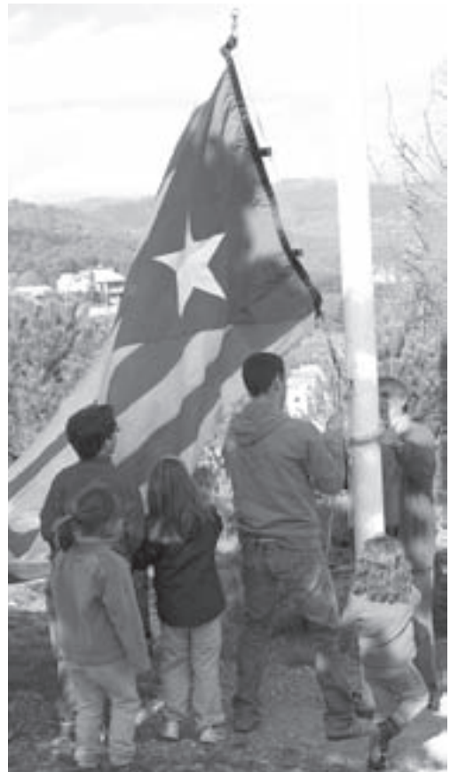
Hissant l'estelada