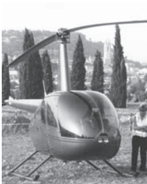
Helicòpter, a la Fira, l'any 1993

La veritat és que, per a mi i molts d'altres que van gaudir d'aquests vols, resultà una experiència summament agradable i deixà un record per a tota la vida.