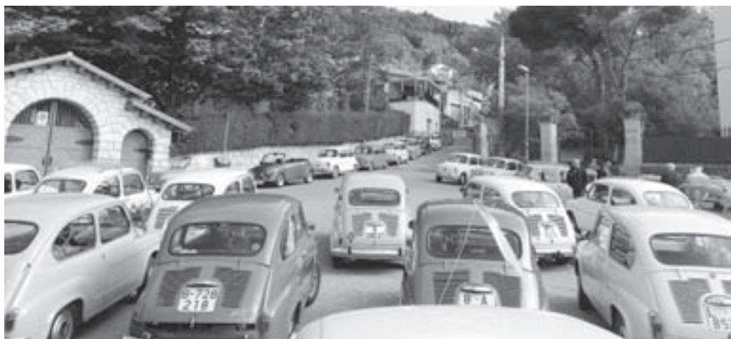
Concentració de 600 a la plaça del Moianès

Però el millor de tot plegat van ser els participants . Quin ambient tan meravellós de companyonia i germanor! Gràcies a tothom per fer-ho possible i fins l'any vinent!