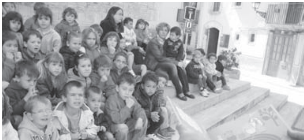
Lectura d'un conte a la plaça Major

Coincidint amb la diada de Sant Jordi, els nens i nenes de l'Escola Pia van participar, juntament amb totes les escoles del Moianès, en l'activitat «Llegim al carrer». Les classes de quart a sisè havien preparat a l'escola diversos poemes de Joana Raspall i altres autors i els van recitar en diferents espais del poble. Un cop acabada la seva actuació, anaren a escoltar els alumnes de les altres escoles i de l'institut.