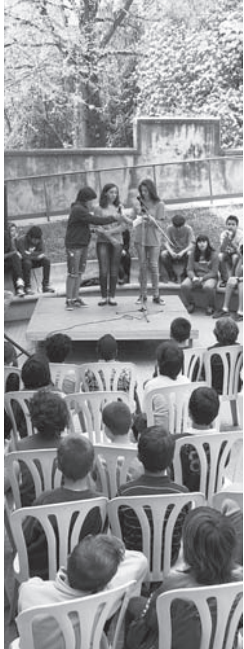
Llegim al carrer (fot. Bibl. Moià)

Durant el mes de maig s'ha pogut veure a la biblioteca la mostra de pintura lliure Despentina't, sigues tu , realitzada per dones moianeses amb motiu de l'acte que es va fer a Moià el Dia Internacional de la Dona.