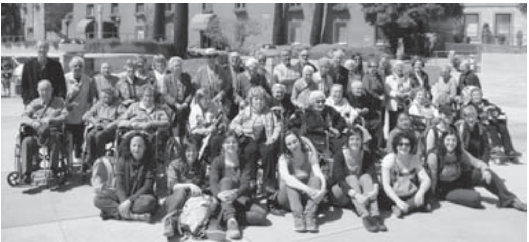
Excursió a Montserrat

Aprofitem l'ocasió per a donar les gràcies a totes les persones que col·laboren amb l'Hospital-Residència de la Vila de Moià.