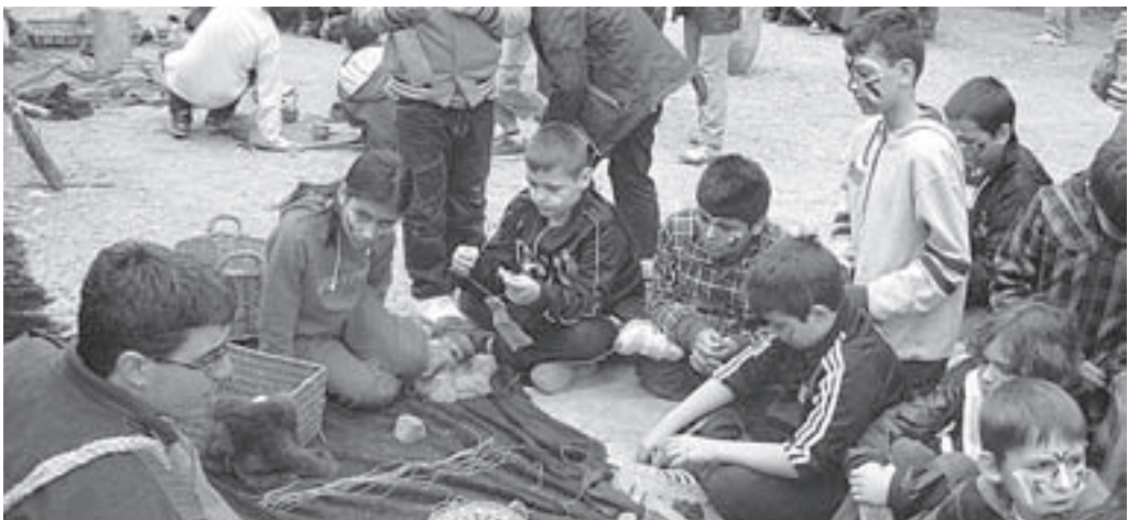
Mercat Escolar de la Prehistòria