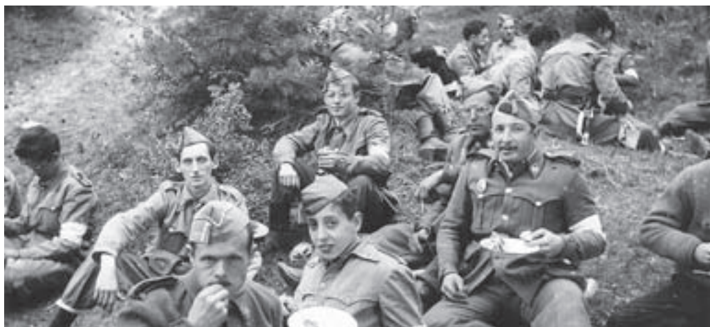
Dinant a la Fàbrega, durant unes maniobres

Algunes vegades ens tocava fer maniobres. En recordo unes, als anys seixanta, que vam fer al Pol amb els de Manresa. Vam pujar i baixar carregats amb malalts i després vam fer una desfilada per Collsuspina i vam anar a dinar a la Fàbrega.