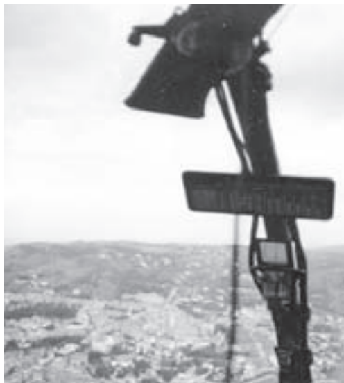
Moià, des de l'helicòpter (fot. J. Roca)

El primer viatge va enlairar-se de darrere el cementiri, com era costum, i em va produir una mica d'impressió veure, tot seguit d'haver-nos enlairat, la riera de la Falcia, els masos de Castellnou, el Prat, el Masot, els Clapers, la Granoia, Cal Nespler, Ferrerons i, seguint en direcció a l'Estany, les Cases, la Caseta Alta, la Guantera, Garfis i la urbanització de la Monjoia. Vàrem planejar fins al poble de