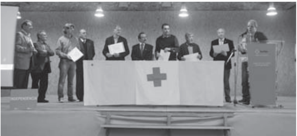
Presència moianesenca en l'acte de Les Faixes

I, preguntat pels reptes de futur, el president de la Creu Roja al Moianès conclou que, «tenint en compte la crisi, hem de treballar molt per ajudar les persones. Però, com es va poder veure el dia del centenari, tenim molts joves disposats a col·laborar. Això és l'important».