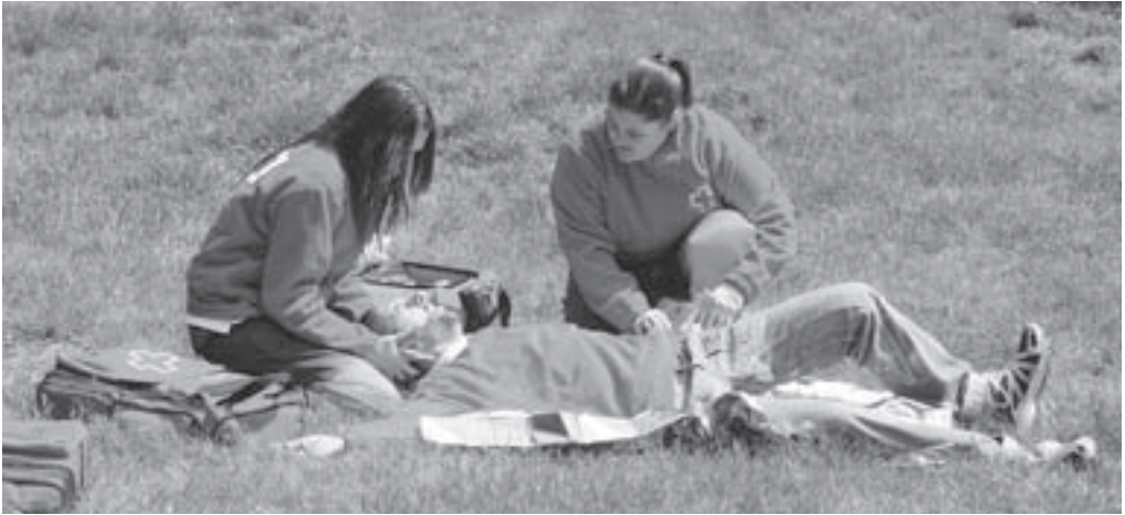
Exercicis d'intervencions d'emergència al parc municipal

aquest sentit, per exemple, a Moià tenim uns kits de menjar per a la gent gran amb problemes econòmics; aquests kits cobreixen en aquests moments les necessitats mensuals de cinc persones. La nostra feina és vetllar per veure les necessitats que hi ha.»