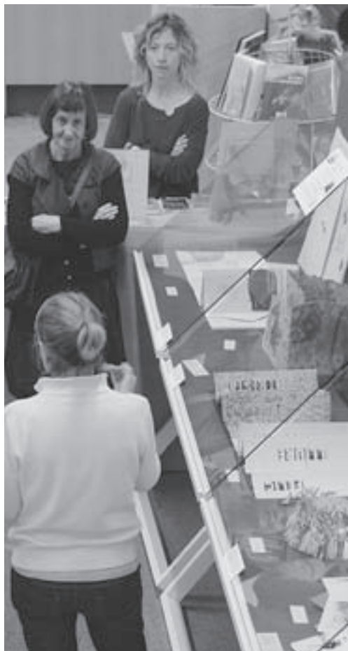
Mostra de llibres-art