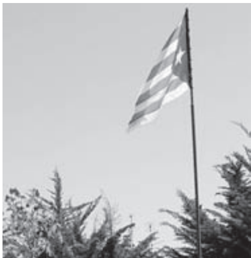
Estelada a Castellterçol

al poble «només» va votar un 46% en la consulta del febrer del 2011. El text, després, s'enreda en consideracions morals, fent barreja amb altres entitats que considera corresponsables del tema i recorda, no cal dir-ho, la sobirania del poble espanyol.