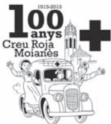
Logotip dibuixat per Picanyol

El dissabte 18 de maig, coincidint dia per dia amb l'efemèride, es va celebrar el centenari de la Creu Roja al Moianès. No passa gaire sovint que una entitat arribi a aquesta venerable edat. I, per aquest motiu, es va voler commemorar de manera solemne.