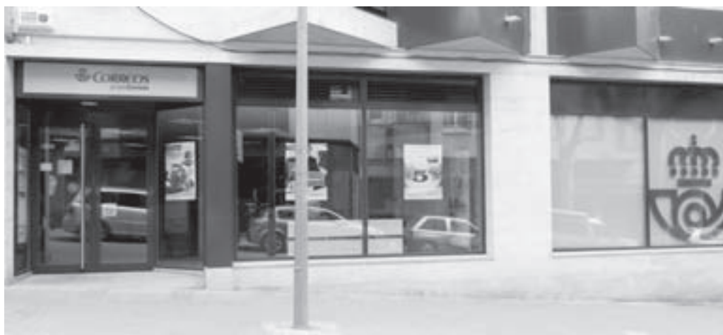
Noves instal·lacions de Correus, a l'avinguda de la Vila