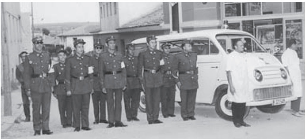
Efectius de la Creu Roja, l'any 1970

A aquell home li semblava que no podia ser que treballéssim de franc.