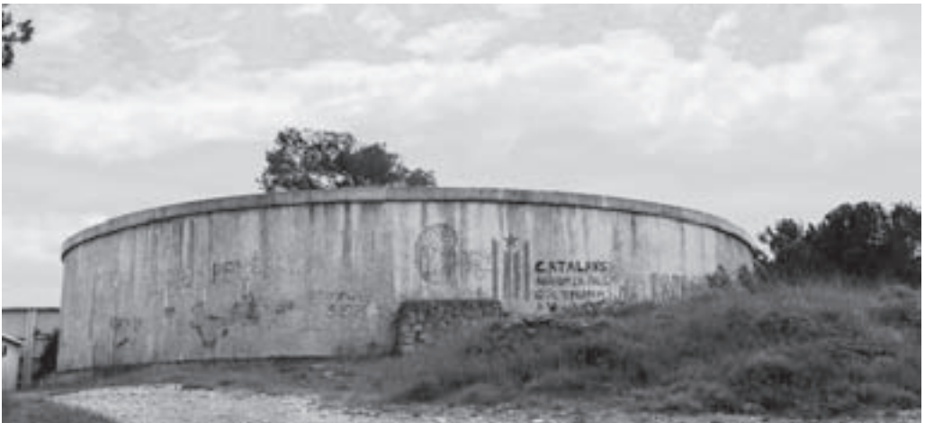
Dipòsit d'aigua de Montbrú

Vist des d'aquesta perspectiva —no endebades, imagino, l'única possible—,