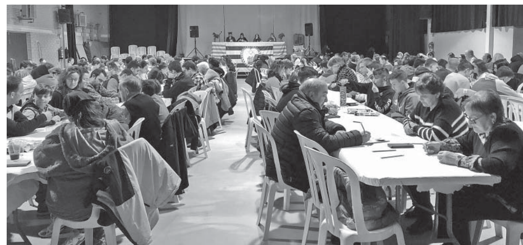
Una de les sessions del Quinto de Nadal, al pavelló de l'Institut Moianès

Moltes gràcies a tots els qui ho feu possible!