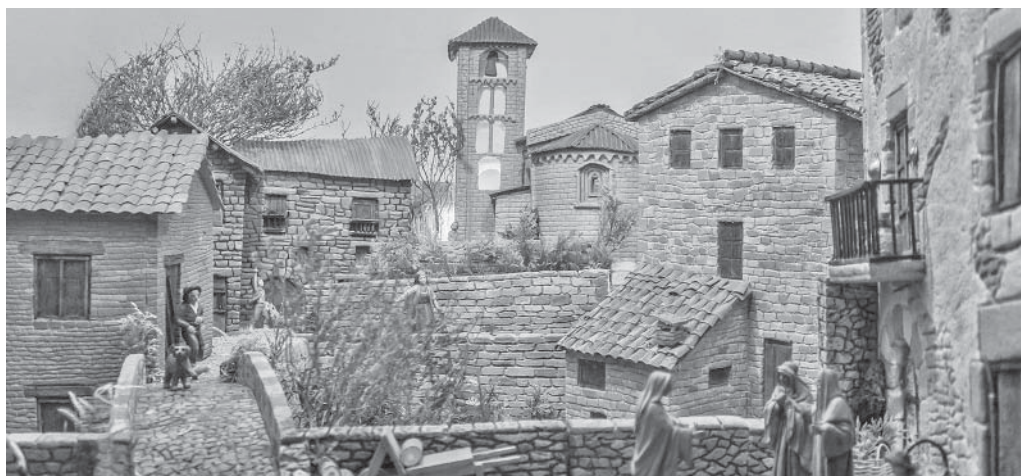
Un dels diorames de l'Associació de Pessebristes

es minoritàries. Arreu del territori català es van desenvolupar diferents activitats abans, durant i després del dia 15, que és quan TV3 va organitzar un dels programes televisius amb més audiència de l'any i en el qual el seu famós marcador va mostrant els diners que s'han recaptat. La nit del 15 va acabar amb més de nou milions d'euros que segur que tindran un destí esperançador. Perquè quedi constància del que es va fer a Moià, començem pel diumenge 15 i el concert solidari a l'església de l'Escola Pia, organitzat per l'Escola de Música del mateix centre escolar. Es van recaptar uns 200 euros. A l'Escola Josep Orriols i Roca, alumnes, professors i amics van fer una flashmob i «el pati ple de monedes» el 13 de desembre, en què es pogueren reunir 423,40 euros. Aquest mateix dia l'Escola Pia va organitzar a les tres de la tarda una cursa solidària amb inici a la plaça del CAP, que va finalitzar sumant 689,90 euros més. Amb el mateix anhel recaptatori, els estadants de l'Hospital-Residència van fer figures de sal decoratives per vendre i van recaptar 193 euros. El diumenge 15 els alumnes del Cicle Formatiu de l'Institut Moianès van fer manualitats que van vendre a la Fira del Tió, l'escola d'idiomes