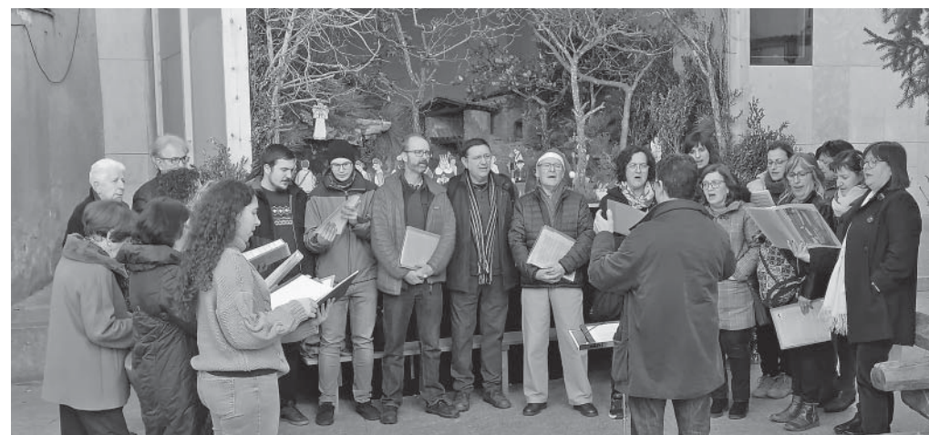
La Coral cantant davant el «Gran pessebre»

Només set setmanes després de la concorreguda Fira de Fires té lloc la V Fira d'Hivern Capgirem l'Avet. Aparador artesanal i del comerç local, amb molta presència culinària i amb la repetició, després de l'èxit de l'any passat, del tastet de tipus de xocolata ben diversos. Amb una plaça Prat de la Riba on no es podia fer un pas i, malgrat un fred gèlid, el 7 de desembre apareixia tota una panoràmica d'orfebria, quincalleria, els prestigiosos embotits