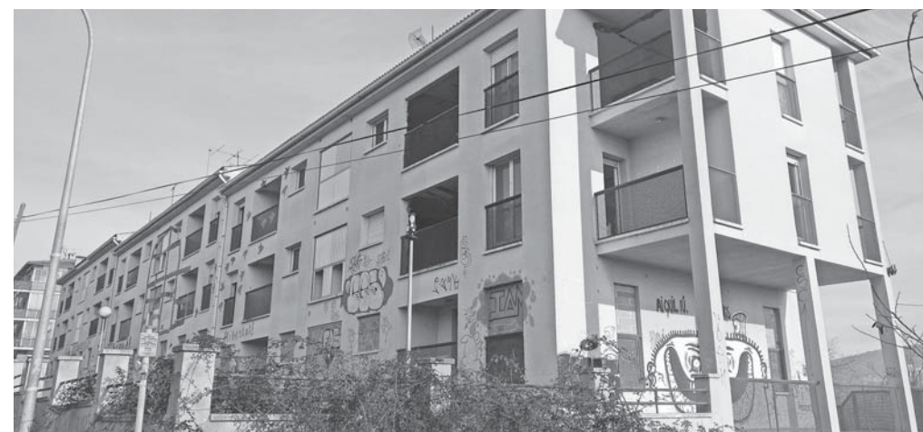
Antiga caserna de la Guàrdia Civil