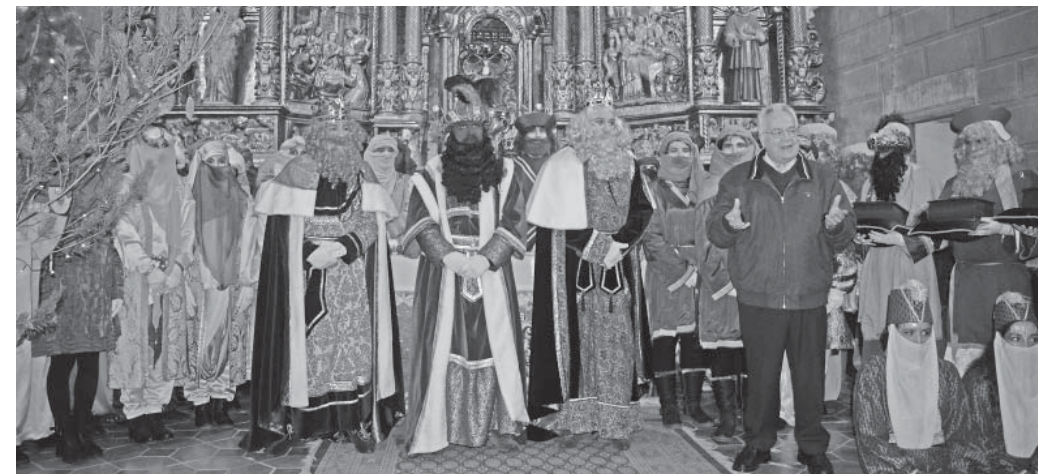
Els tres Reis, a l'església vella d'Oló

La cavalcada d'enguany ha arribat a les sis de la tarda i la majoria de nens, acompanyats dels seus pares i familiars, els han rebut a l'entrada del poble. Amb el grup local Batuca l'Olla han estat acompanyats fins a l'església vella, on els reis han fet les ofrenes i l'adoració del nen Jesús. Seguidament s'han dirigit cap al pavelló esportiu, on els infants han rebut de mans dels Reis els regals que van demanar en les cartes i que van entregar el 29 de desembre a les princeses vingudes d'Orient. Abans de l'entrega de regals sempre es fa una pregunta a cada rei sobre l'actualitat del país.