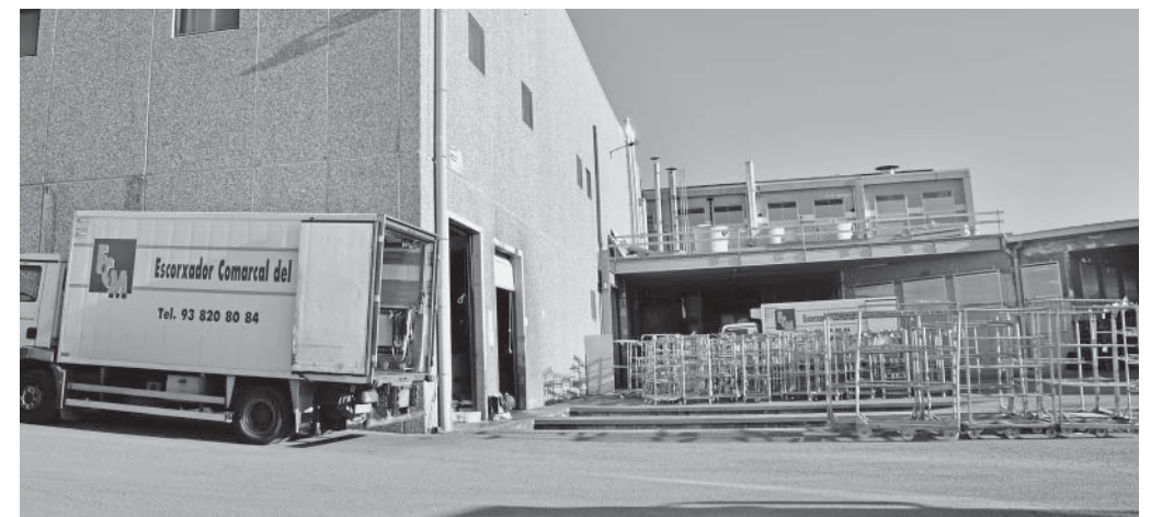
Escorxadador Comarcal del Moianès

«Som en un pou i a les portes del col·lapse. I ara que teníem un nou secretari plega. I plega per l'actitud de les regidores de Junts per Moià. Això no ho dic jo tot sol,