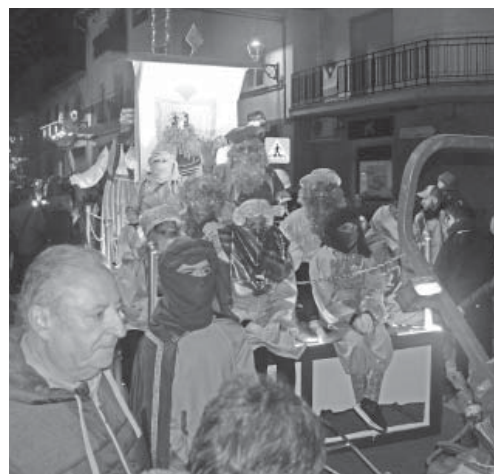
Una de les carrosses dels Reis d'Oló

Entre una cosa i l'altra, al final de la dècada dels cinquanta Oló va tenir la millor cavalcada dels Reis d'Orient de la comarca. La festa va canviar totalment. La comitiva dels reis era formada per tres carrosses arrossegades per un tractor. A cada carrossa hi anava un rei amb els seus patges; un camarlenc, també amb els seus patges, i dos patges més amb torxes per a il·luminar alimentades amb teia de pi blanc. Arribava la cavalcada per l'avinguda Manuel López acompanyada per la música d'una orquestra, que durant molts anys va ser la Rosaleda de Sallent. Seguidament anaven a fer l'adoració a l'església vella, on oferien or, encens i mirra al nen Jesús. Després, al Centre Recreatiu es repartien les joguines per a totes les persones que les haguessin portades. També es va establir el que es deia vulgarment «els reis per als fills dels