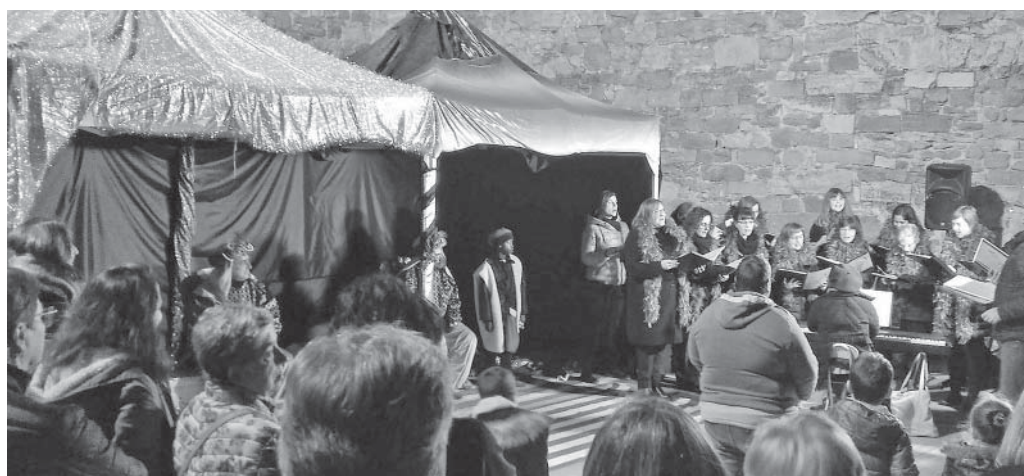
El Cor Xera cantant en la rebuda al carter reial

L'ABIC també hi és. L'Associació de Botiguers i Comerciants de Moià (ABIC) ha fet durant aquestes festes i fins al dia del sorteig una campanya per promocionar els comerços de proximitat de la vila, adreçada al compradors majors de setze anys, amb un premi de 500 euros i deu de 100 euros, per a comprar als comerços en què només s'havia d'omplir una butlleta i posar-la a la bústia que tenia cada establiment. Per la seva banda, els infants i joves menors de setze anys havien d'escriure un desig en un estel i entre ells se sortejaran tres premis de 50 euros. El sorteig es farà el dia 28 de febrer.