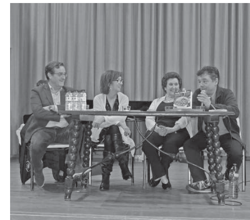
Acte de presentació