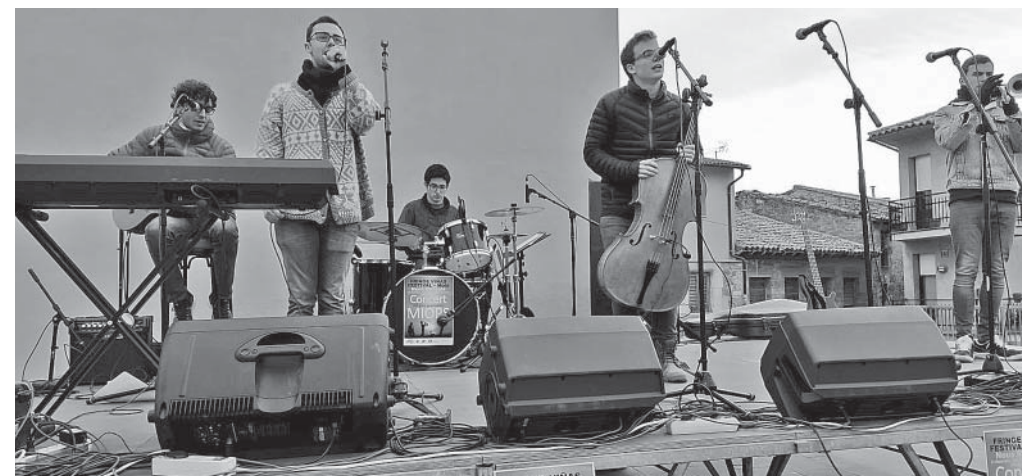
Concert del grup MIOPS, a la plaça del CAP