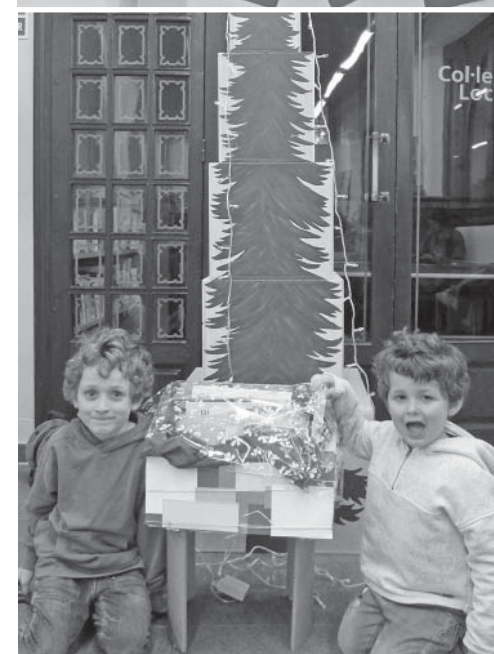
Guanyadors de la llumineta