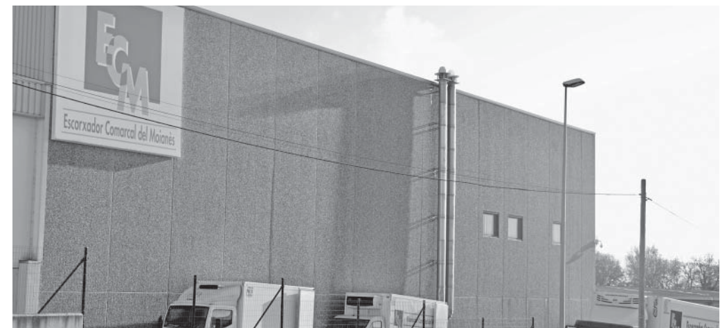
Escorxadador Comarcal del Moianès