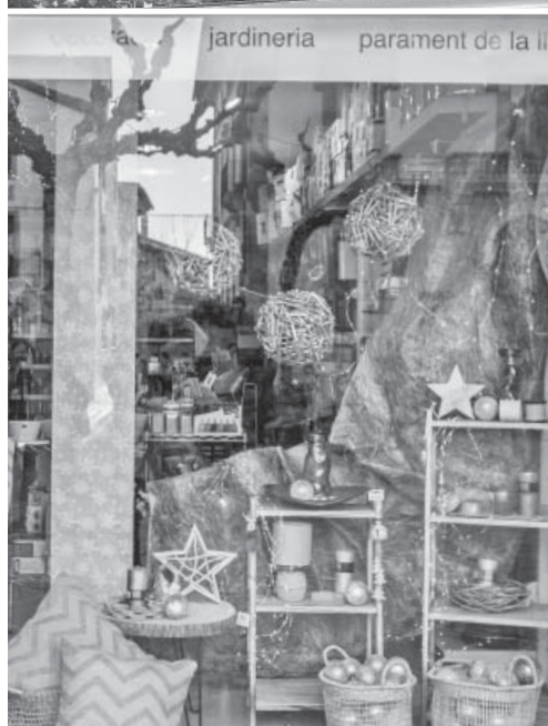
Dos dels aparadors «felicitats»