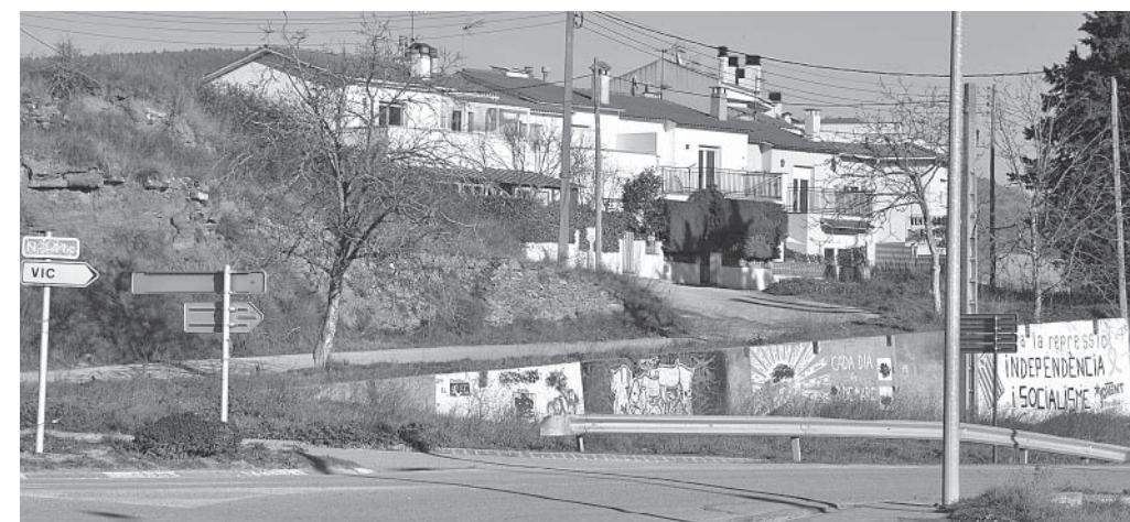
Parcel·les afectades pel conveni signat amb A. Estevadeordal

«Dels desafiaments econòmics als reptes judicials» era el títol d'un article publicat a LA TOSCA l'octubre del 2013 (núm. 741). L'ajuntament, basant-se en un dictamen de la Comissió Jurídico-Assessora de la Generalitat (CJA) —creada en 1932 i represa en 1978, és l'òrgan assessor de la Generalitat encarregat de vetllar per la legalitat de l'actuació de l'Administració de la Generalitat i dels ens locals a Catalunya—, va declarar nuls dos