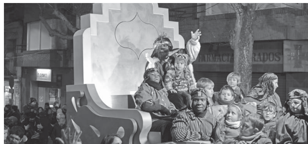
El rei Baltasar, en la cavalcada de Moià