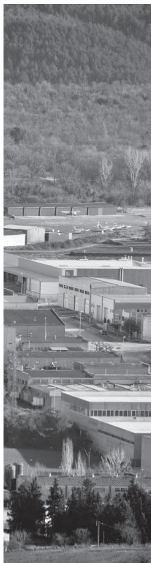
Fot. Josep Font