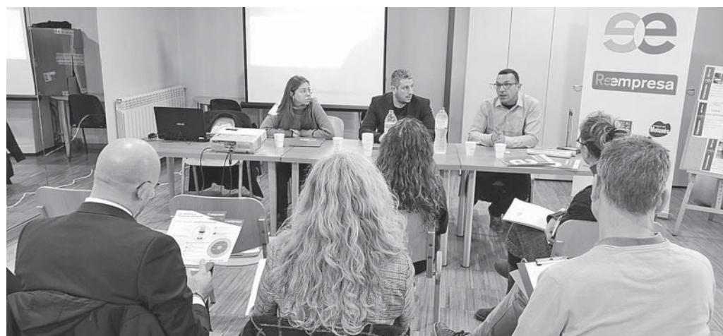
Sessió del programa Reempresa, a Can Carner (fot. Consorci del Moianès)

Llavina creu que és essencial el paper dels prescriptors perquè puguin donar a conèixer el projecte. «És un servei sense cost per a l'usuari i una oportunitat magnífica per a evitar que tanqui el seu negoci. És molt important que sàpiguen que disposen d'aquest programa que ajudarà que el reemprenedor pugui tirar endavant un nou projecte sense haver de començar de zero.»