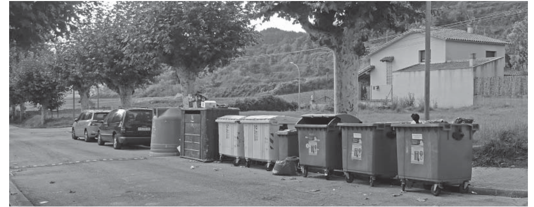
Passeig del Prat de l'Estany, amb vuit contenidors, l'octubre passat (fot. D. Prat)

El 15 d'octubre l'Estany es va afegir a la llista de pobles que van implementant la recollida de residus porta a porta. Empès pel baix percentatge de reciclatge del poble i per les consignes nacionals i internacionals cada vegada més insistents i inqüestionables —la Unió Europea, per exemple, obliga a reciclar el 50% dels residus ja aquest any 2020—, l'ajuntament va decidir impulsar aquest canvi. Fins a l'octubre, l'Estany reciclava només un 19% de les escombraries. En una dècada, s'havia passat del capdamunt del rànquing de pobles recicladors del Bages al capdavant de la llista del Moianès.