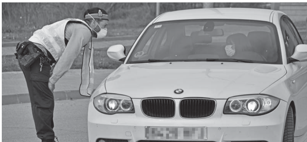
Control a l'entrada de Mojà

I en relació al col·lapse de cotxes que hi va haver alguns dies de Setmana Santa al voltant dels supermercats i alguns carrers, s'ha de tenir en compte que qui habitualment va a comprar a Manresa o Vic, ho feia a Mojà per evitar els controls. I molts que haurien estat esquiant o de viatge, eren a Mojà. Sumem-hi els cotxes dels fills que van venir, i potser ens adonarem que el nombre d'estiuejants que es van confinar aquí és molt més petit.