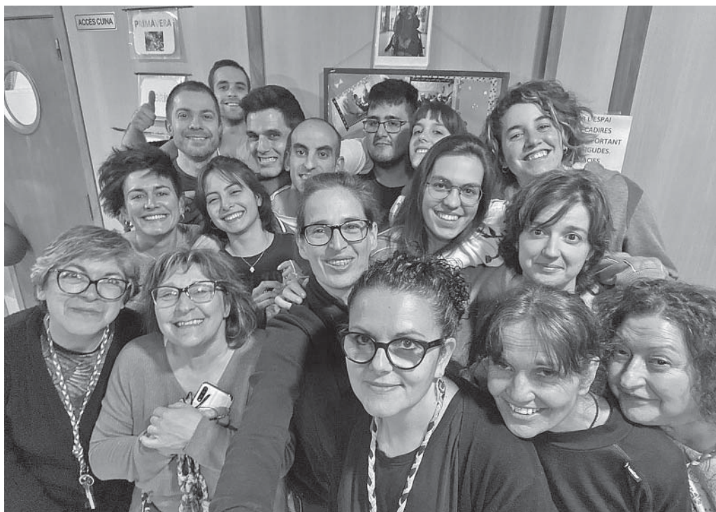
17 històries solidàries

d'ofec dins de l'habitació. «Ens volien tancar com a conills o gossets», ens diu, i també posa en relleu el tracte familiar de tota la casa; parlant dels 17, diu: «Tenen un cor que no els cap a dins.»