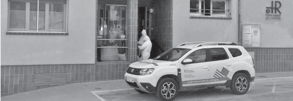
Membres del servei d'urgències d'atenció primària davant l'Hospital-Residència

En aquests moments que ens toca de viure com a individus i com a societat tan inimaginables fa unes quantes setmanes, se'ns han plantejat molts reptes a diferents nivells i ens hem hagut d'anar adaptant a situacions que mai no hauríem pensat que ens tocaria de viure.