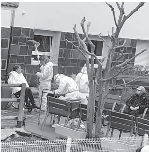
Equip de TV3 a La Ginesta