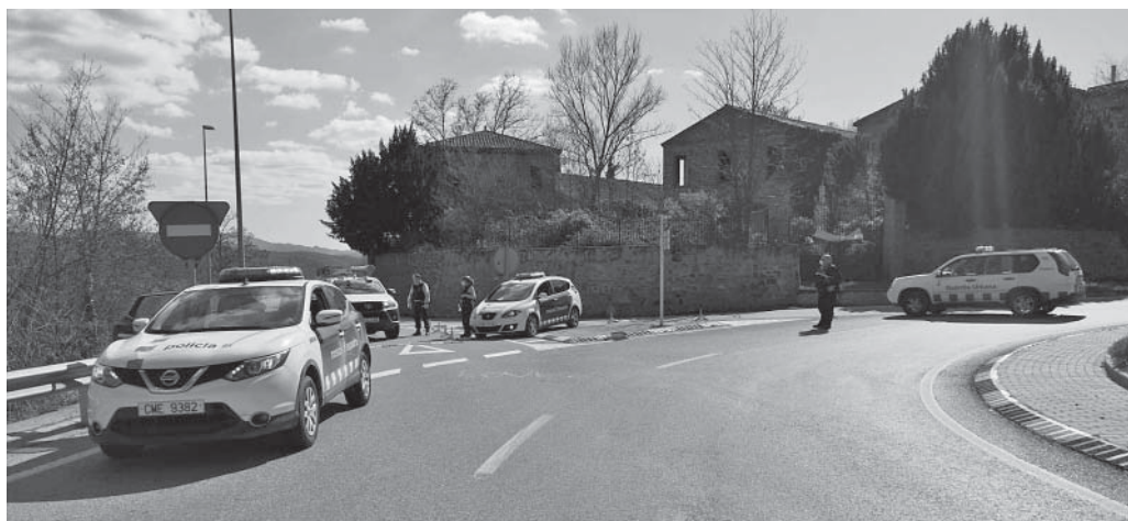
Control dels Mossos amb la Policia Municipal de Calders

En la majoria de casos hi ha hagut comprensió tot i que hem tingut alguna intervenció delicada i no hem d'oblidar que