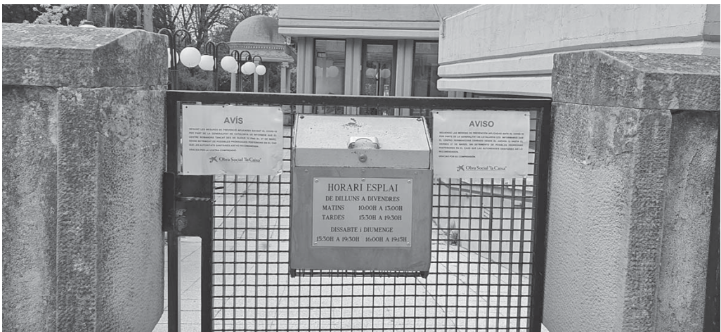
Entrada a l'edifici de l'Esplai, amb els cartells del tancament

Els grups de whatsapp dels diversos tallers i activitats permeten de mantenir el contacte entre ells; en el moment d'escriure aquestes ratlles, tothom estava bé.