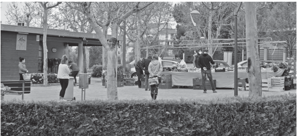
Fent cua en el mercat del dimarts, a Oló

Ja des de bon principi els olonecs es van organitzar per ocupar el temps. A través de les xarxes socials la gent començava a penjar pastissos casolans, com si fos un concurs. Altres enviaven fotografies d'ells mateixos quan eren joves, la mainada penjava els dibuixos que feien... D'altra banda, el dia 23 de març, l'ajuntament publicava les bases del concurs Jo em quedo a casa , una iniciativa per a promoure la creació literària, artística o musical al voltant de la situació d'alarma