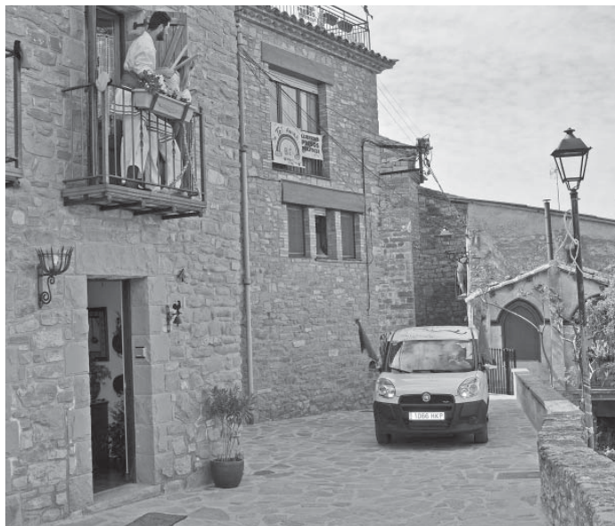
Les caramelles es feren presents el dia de Pasqua amb la furgoneta de l'ajuntament

d'aquest. Amb la furgoneta de l'ajuntament, equipada amb bons altaveus, s'han passejat per tot el poble fent gairebé el mateix recorregut i les mateixes parades d'una diada normal. La resposta de la gent ha estat molt positiva. En molts casos podies veure persones als balcons vestides de catalans/es o de bastoners/es. Fins i tot, en algun raval, un grupet de veïns s'ha atrevit a executar algun ball de bastons. Dins el repertori de caramelles no hi podia faltar la sardana La Rosa d'Oló , de la qual aquest any s'havia preparat un nou arranjament per cantar. Tot un èxit; l'enhorabona a l'entitat.