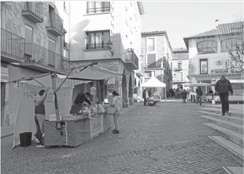
Cues per a comprar el pa i poca aflluència de paradistes en el primer diumenge de confinament