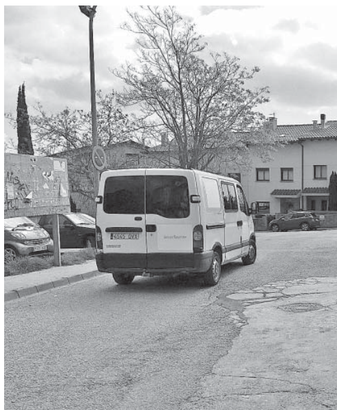
Furgoneta sense logotipar

Sí, del tot. Seguint les instruccions del sector, quan hem d'entrar en contacte ens posem polaines, granotes, guants, mas-