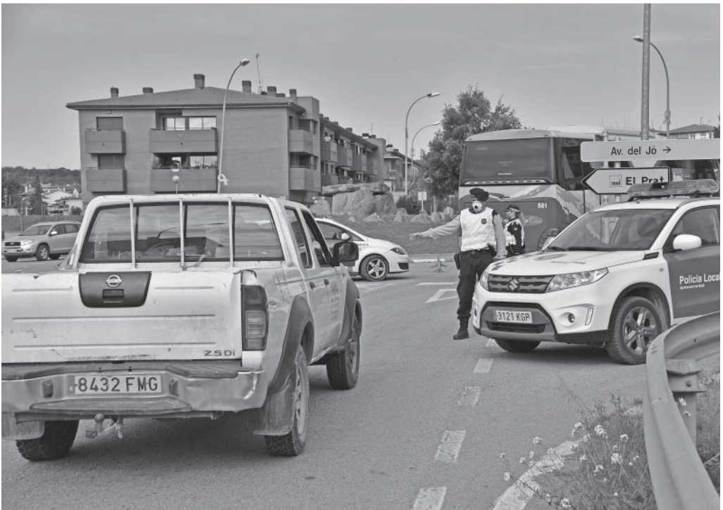
Controls dels vehicles que circulen per la carretera