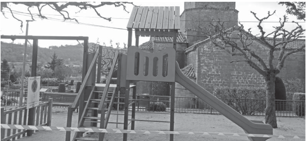
Una àrea de jocs infantils tancada per l'Ajuntament de l'Estany

A l'Estany tenim obertes les tres botigues del poble (el forn, la botiga de queviures i la farmàcia) i es manté la parada de fruita i verdura del dimarts al costat de l'ajuntament. Els establiments que s'han vist obligats a tancar han estat els tres bars.