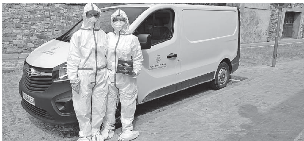
Vehicle cedit per l'Ajuntament de Moià a l'EAP Moià-Castellterçol

Del que no té dubte Guiteras és que en el futur immediat canviaran moltes coses. «Només amb el teletreball ja hem après, de cop, molts pros i contres, tant des de l'ajuntament com en les empreses.»