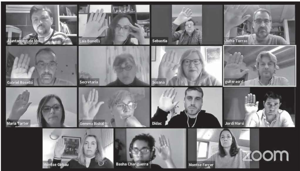
Participants en el ple telemàtic de l'Ajuntament de Moià

oposat a l'ambient enrarit que havia descrit LA TOSCA fa uns quants mesos.