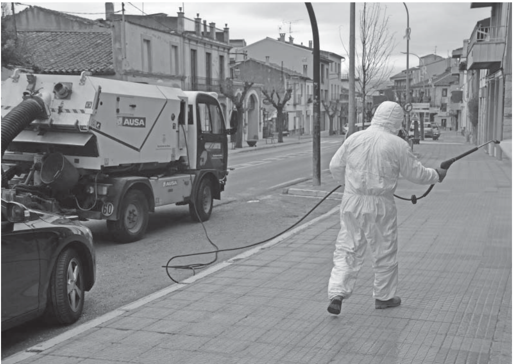
Tasques de desinfecció al voltant de les zones comercials