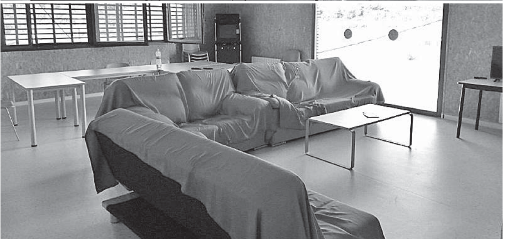
Sala de control i d'emissores. Cuina. Menjador i sala d'estar