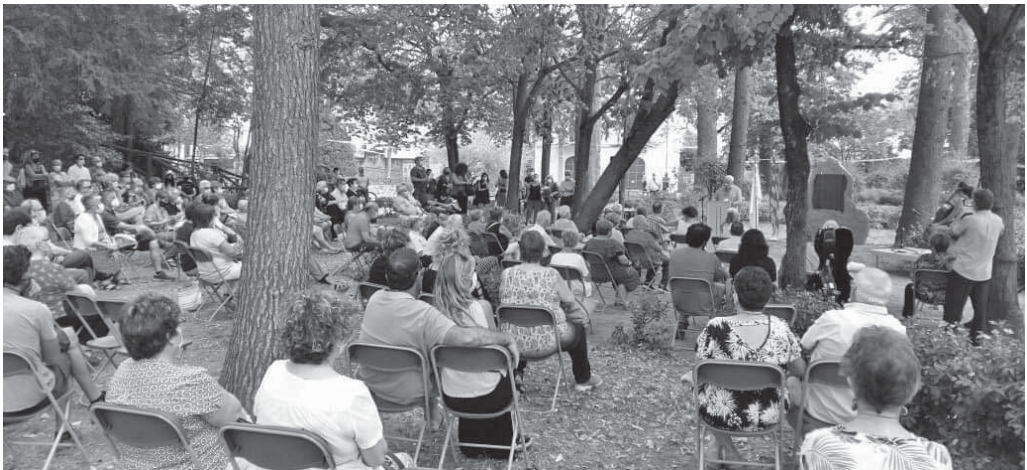
Acte d'homenatge a les víctimes del Covid-19

El dia 17 al matí al parc municipal tingué lloc un acte de record de tots els difunts de Moià durant la pandèmia, organitzat per l'ajuntament de la vila amb la presència del consistori i de l'alcalde, Dionís Guiteras, que dirigí unes paraules als presents. Es va descobrir una placa en un monòlit entre l'estanyol i la glorieta vermella amb unes paraules de la poetessa Glòria Pons: «La vostra vida és llum que ens encamina / vers un demà que encara ha d'arribar; / qui no s'apaga sempre ens il·lumina: / qui viu a dins del cor no morirà!» Un centenar de vilatans assistiren a l'acte, en què també hi havia familiars