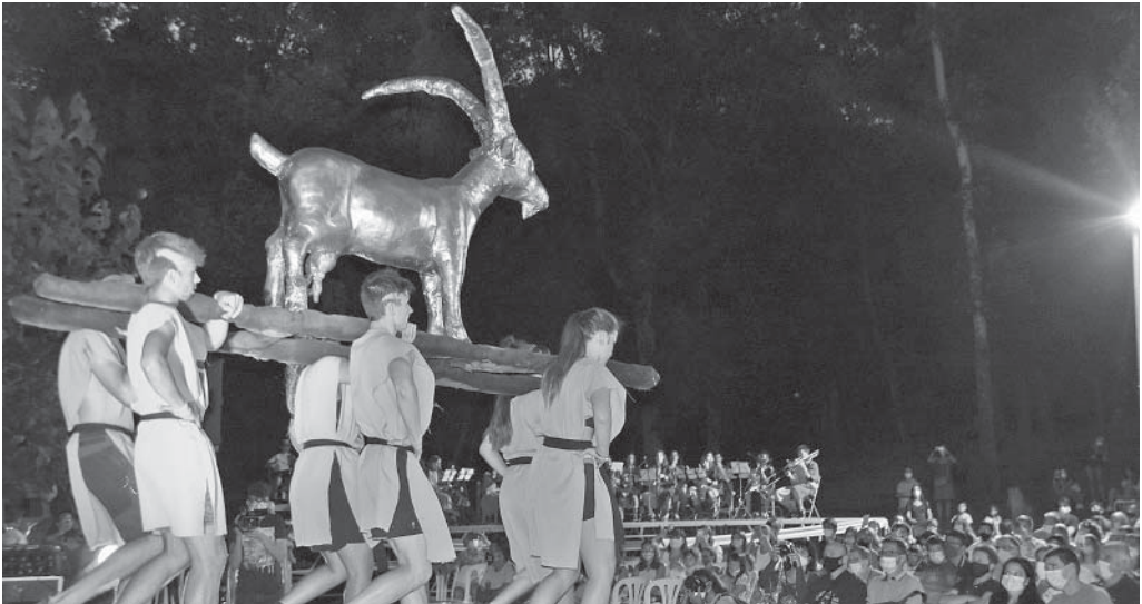
La Cabra d'Or amb la Banda Àuria al fons

La Cabra d'Or, festa vinculada a la llegenda medieval moianesa del mateix nom, ha esdevingut el vibrant tret de sortida de la festa major de la vila des de la seva creació, l'any 2010. Enguany, però, i com la resta d'actes i celebracions, s'ha vist condicionada per la vigència de la pandèmia global de Covid-19 que està patint la humanitat.