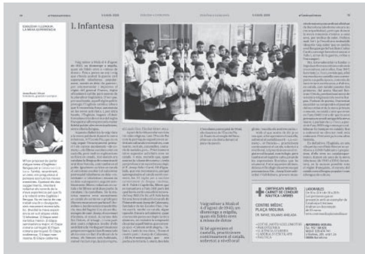
Primer capítol de les «minimemòries» publicades a Catalunya Cristiana

Calders, amb el permís de poder continuar residint a Mojà i prosseguir les seves tasques culturals: docència del català a nivell de perfeccionament (Barcelona), publicació de llibres i articles, traducció de documents del magisteri eclesiàstic i d'altres volums de temàtica religiosa, moltes correccions, etc. A destacar, en aquesta etapa, l'encàrrec per part de l'actual bisbe de Vic d'elaborar, ell com a lletrista i el seu gran amic Mons. Valentí Miserachs com a compositor, un oratori musical en homenatge als bisbes Oliba i Torras i Bages, titulat Diàleg patriarcal , per a solistes, cor i orquestra, oratori que s'interpretà amb gran èxit de públic a la catedral de Vic,