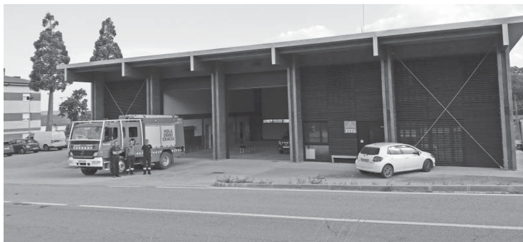
Nou parc