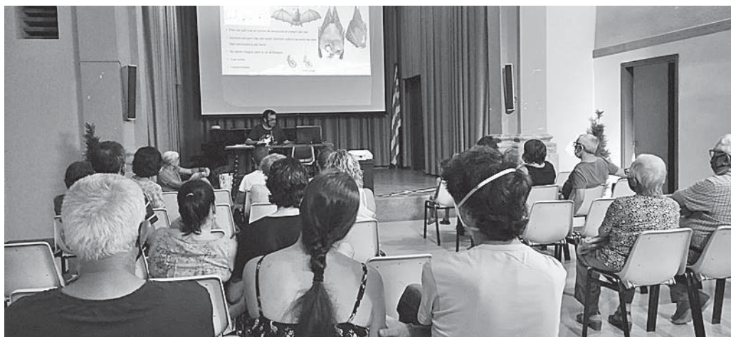
Explicació introductòria de la Nit dels Ratpenats, a l'Auditori de Sant Josep

Acabem l'agost amb una nova exposició temporal al Museu de Moià. L'artista Sergi Ricart ens presenta Visions de la natura. Escultures, xilografies i aquarel·les . La mostra, que ofereix diferents tècniques i matèries, es pot visitar des del 27 d'agost fins al 30 d'octubre.