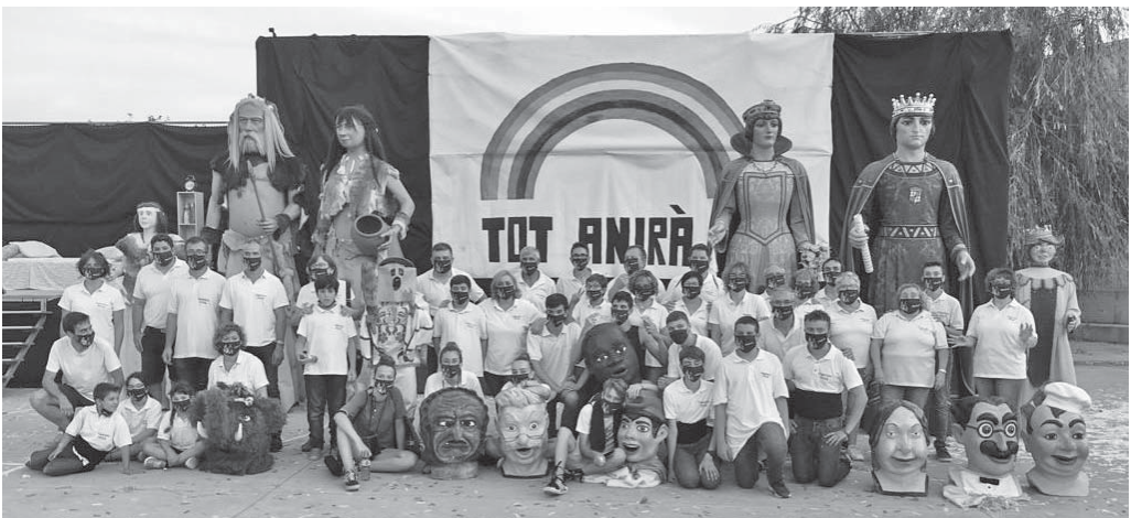
Els geganters amb els protagonistes del conte «Acolorim Moià!»

Donades les circumstàncies actuals es va desestimar de fer el vermut habitual de festa major a la plaça de davant l'església. Es va optar per fer-lo a l'esplanada de l'estanyol del parc i organitzant-lo en dos torns d'assistència: el primer de 12 a 13.30 i l'altre de 13.30 a 15 hores. Amb la condició de posar-se gel desinfectant a l'entrada, hom podia accedir a qualsevol de les taules que hi havia disposades per a degustar el vermut i alhora gaudir de la música oferta per la Banda del carrer Montseny.