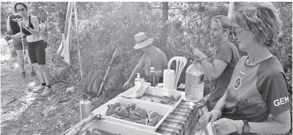
L'únic avitallament, de síndria, de la caminada alternativa

Davant les dificultats es demostra quan una entitat o un col·lectiu passen o no per un bon moment. I els Geganters de Moià novament van ensenyar a tot el poble que viuen un moment dolç, amb molta gent formant-ne part i col·laborant en les seves activitats. Així, com que la vigília de la festa major no van poder fer la tradicional cercavila pels carrers de la vila, van muntar, al pati de l'Escola Josep Orriols, un espectacle diferent. Amb el títol «Acolorim Moià! (un conte gegant)» van presentar una obra teatralitzada, protagonitzada pel capgròs cuiner, acompanyat per la resta de capgrossos (la bruixa, el català, en Gepetto, en Groucho Marx, el negre i la vella) i pel Pollo, a la recerca del millor color de tots. Els diàlegs entre els protagonistes s'anaren intercalant amb danses dels mateixos nans i de les dues parelles de gegants, al so dels grallers i, també, de música enregistrada. La participació del públic consistia a formar els