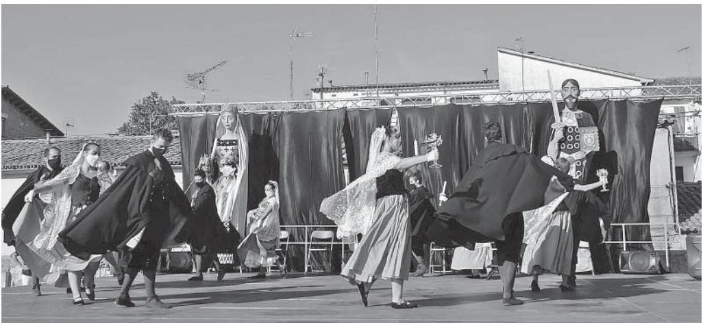
A Castellterçol es mantingueren les danses, amb mascareta

Des de l'Anla-capdavall de la vila, Coll de Mosca-Pedregar, Campanar-centre vila i Capella de Sant Francesc-capdamunt de la vila, es constituí un gran castell de focs que ha substituït el tradicional correfoc. Gran espectacularitat màgica i, sobretot, bona coordinació entre els quatre punts esmentats.