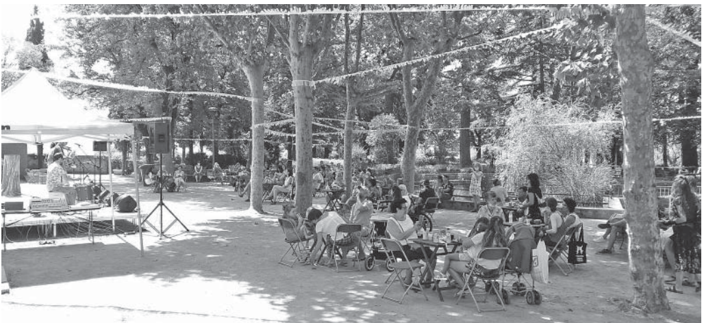
Enguany el vermut de festa major es va fer, asseguts, al parc

Sense Festival Internacional Francesc Viñas, l'únic concert organitzat aquest estiu per Joventuts Musicals ha estat la visita de l'AIMS de Solsona, en el que ja és una tradició esperada de cada temporada estiuenca. El diumenge 16 d'agost, un centenar de persones escoltaren dues peces de Mozart i una de Bach, interpretades per quintet i per orquestra de cambra les primeres, i per solista de violoncel la de Bach.