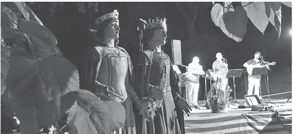
Els gegants també foren protagonistes de les havaneres

La Caminada Popular, organitzada com cada any pel GEMI, acostuma a ser una de les activitats amb més participació durant aquests dies. Com ha passat en altres actes, per evitar d'anul·lar-la a causa de la pandèmia se les van enginyar per a poder celebrar una Caminada Alternativa. La data escollida va ser el dia 9 d'agost: van marcar un recorregut ben atractiu, perquè tothom se'l despengés al mòbil i poder-lo seguir de forma autònoma, un recorregut que va ser més curt del que és habitual — no arribava a 12 km— i amb un desnivell de 314 m. Els 330 participants que els consta a l'organització que la van realitzar pogueren triar l'hora de sortida des de les set del matí fins a les set de la tarda, això sí, sota la responsabilitat de cadascú per