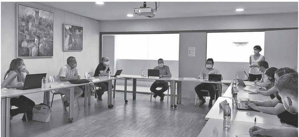
Reunió amb el secretari d'Infraestructures i Mobilitat

Per part dels alcaldes assistents va haver-hi diferents peticions. L'alcaldessa de Sant Quirze va demanar que el procés fos participatiu i que es donés opció al territori a fer les corresponents aportacions per tal que el projecte s'adapti de la millor manera possible a les necessitats de la comarca. L'alcalde de l'Estany va manifestar també que calia que, per al transport pesant que circula per la C-25 i ha d'anar en direcció a Moià, se senyalitzés adequadament la C-25 per a evitar el seu pas pel tram C-25-Estany-Moià.