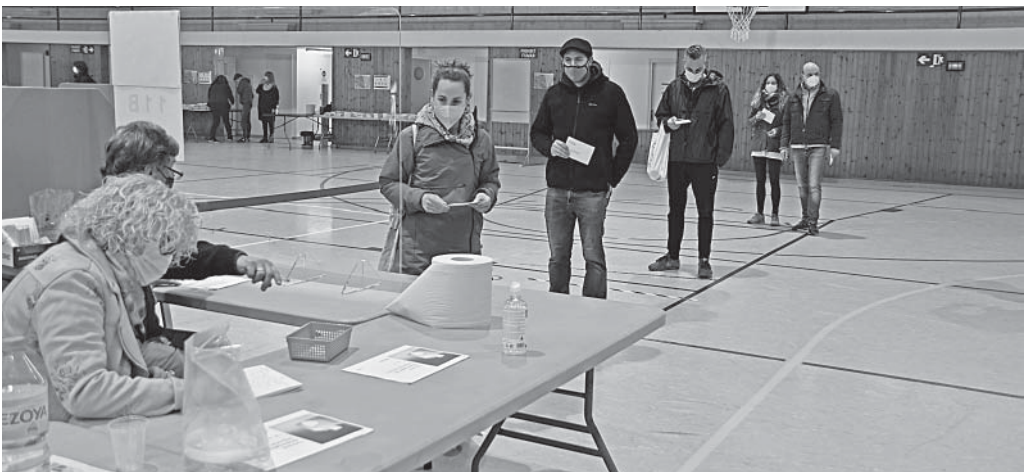
Les meses electorals de Moià es van posar enguany al Pavelló

Amb uns Comuns que només es mouen una dècima en el seu percentatge (3,6%), la resta de l'escenari polític veu com el PSC recupera part dels seus vo-