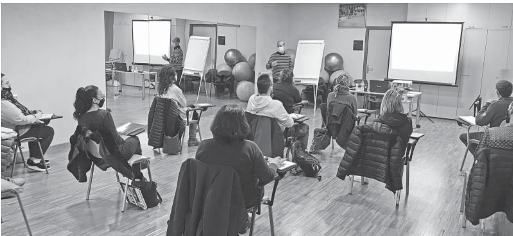
Curs de formació ocupacional, a Can Carner

• Programa Ubica't del SOC. Setze itineraris concedits. L'objectiu és dur a terme projectes que desenvolupin actuacions d'orientació i acompanyament a la inserció laboral de persones desocupades, inactives o treballadores, preferentment les que es troben en una situació de precarietat laboral. Les actuacions ocupacionals que es podran desenvolupar dins aquest itinerari són tant les enfocades al mateix procés de recerca de feina, a l'anàlisi de l'ocupabilitat i de les competències de la persona i a la millora d'aquestes, però també al coneixement de l'entorn productiu i l'apropament a les empreses. L'import concedit ha estat de 30.196,54 euros.