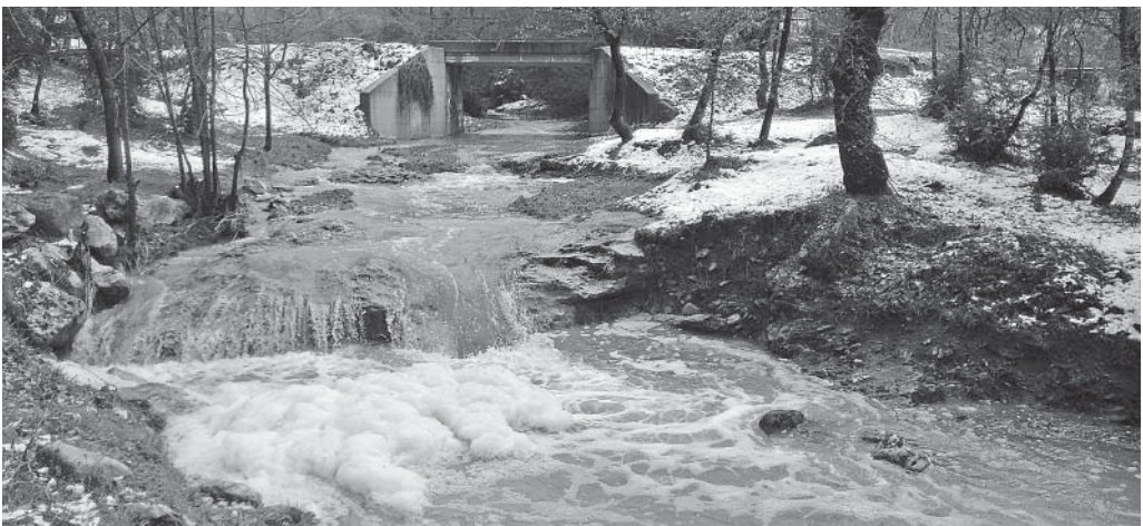
Gorg del Toll al pas del temporal Glòria