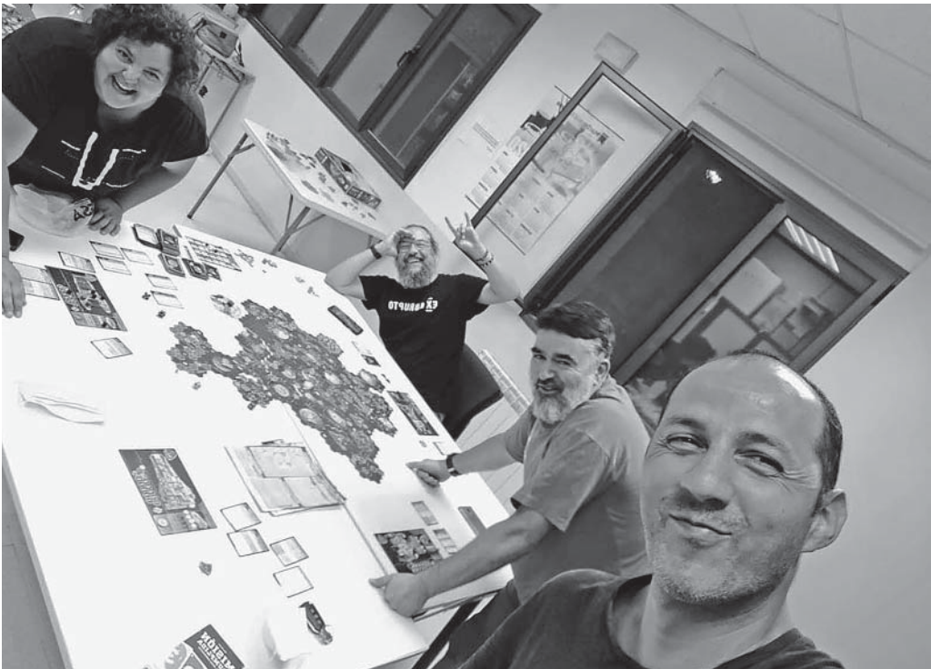
Sessió amb el joc «Xia, leyendas de un sistema a la deriva» a la biblioteca de Calders

En tot cas, la varietat de jocs que hi ha al mercat ara per ara és enorme, fins i tot potser una mica aclaparadora. A Caldaus tenim una ludoteca a disposició dels socis, encara que sovint juguem amb els jocs particulars dels socis mateixos. Per això, si voleu endinsar-vos en aquest món, us convidem a assistir a una de les nostres trobades lúdiques, ja sigui en les sessions ordinàries a Calders (sempre en funció de les recomanacions sanitàries pertinents, és clar) o en alguns dels tastets de jocs que aviat esperem d'organitzar per diverses poblacions de la comarca.