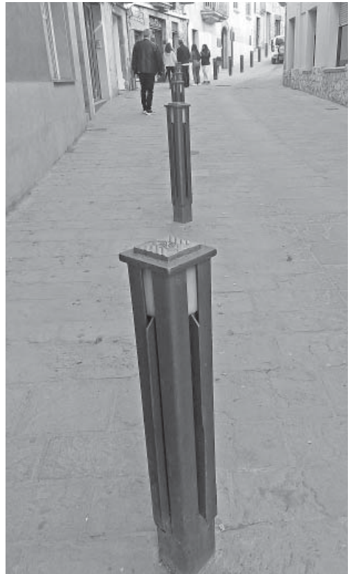
Pilastres del carrer de les Joies, de Josep Codina

El meu pare ja va traslladar el taller en els anys vuitanta cap a la carretera de Vic, hi havia més espai i no es feia tant soroll, al mig del poble no podia ser. Sortosament, moltes coses han canviat per a millorar.