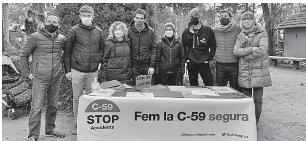
Integrants de la plataforma Fem la C-59 Segura

La nostra voluntat és que el document s'estructuri en les nou principals deficiències que hem detectat a la carretera, i us demanem que ens ajudeu a vestir-lo amb fotografies, opinions, esquemes o mapes dels inconvenients que detecteu a la via.