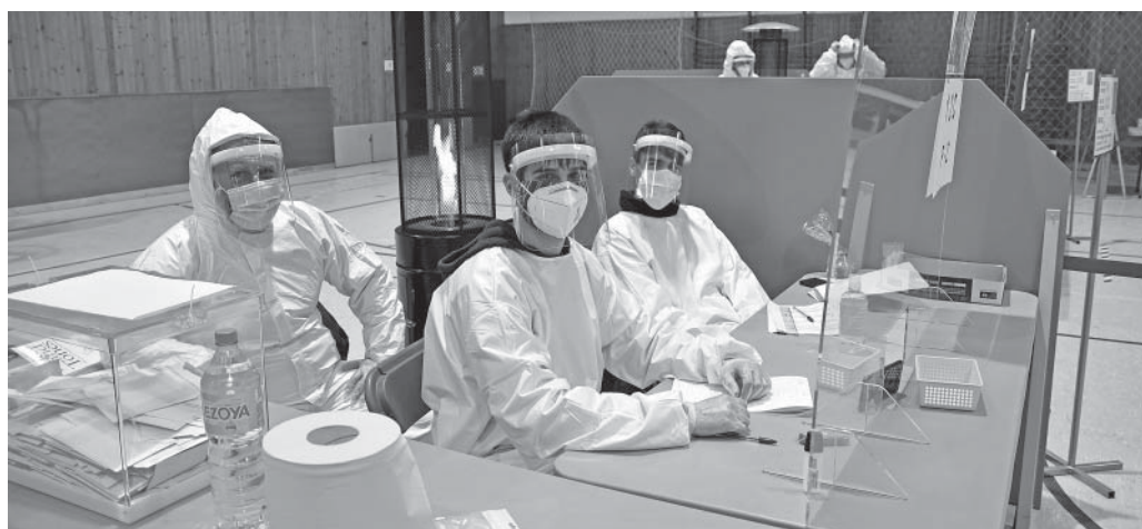
Mesures especials de protecció en la darrera hora