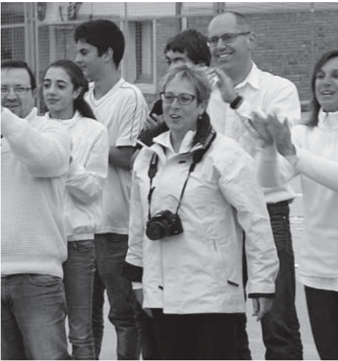
La Mercè, a l'Institut, per Sant Jordi, l'any 2012

junts al passadís, menjant paté i jugant a cartes, units en la dificultat. El diumenge, quan vàrem arribar a l'aeroport, el vol tornava a estar cancel·lat... Vam acordar amb l'agència que aniríem amb TGV de París a Perpinyà, i que des d'allà un autobús ens portaria a casa. En aquell viat-