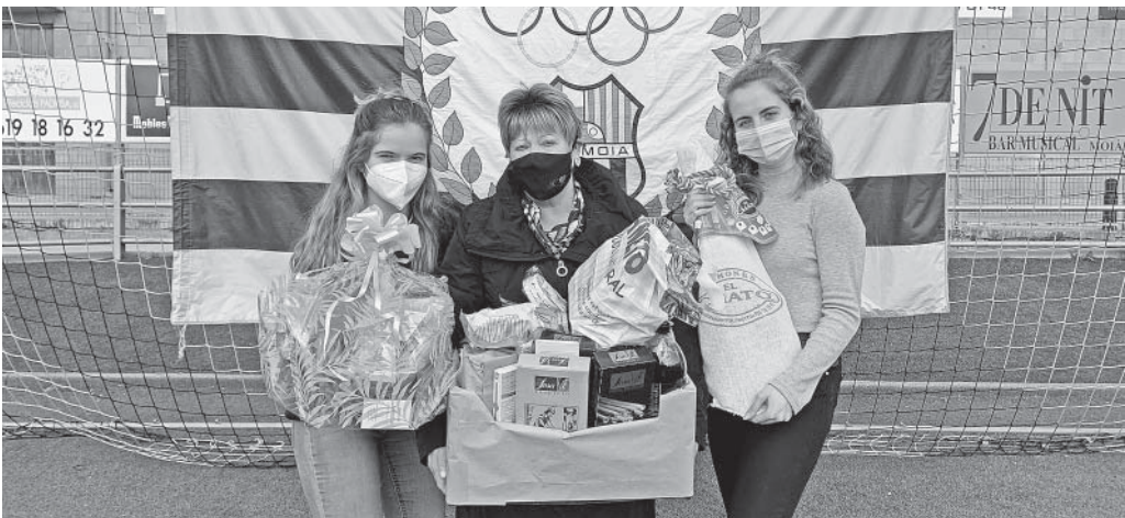
Una de les guanyadores del Quinto