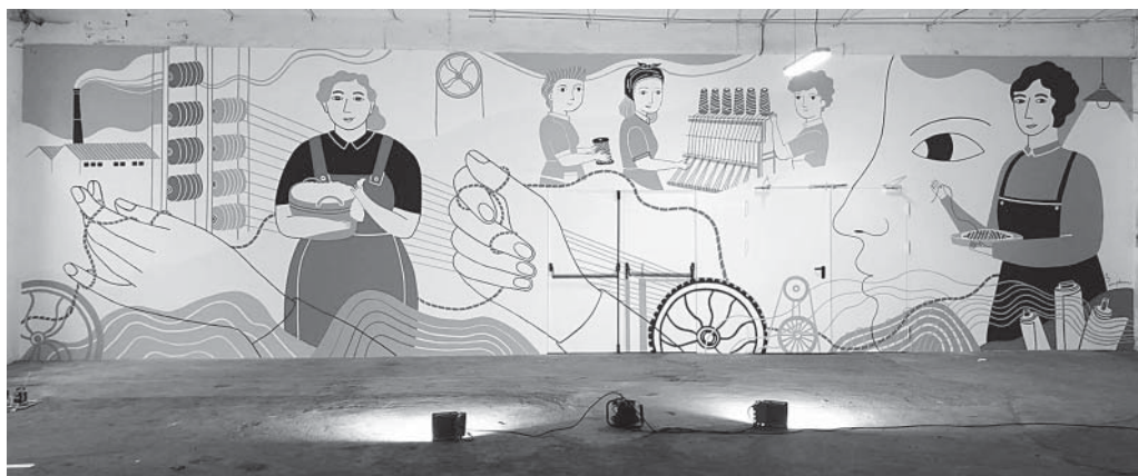
Mural de l'ANLA en homenatge a les dones del tèxtil

A l'edifici de l'ANLA s'ha pintat un mural que vol homenatjar les dones de Castellterçol que van treballar en la indústria tèxtil, silenciades pel soroll dels telers. Aquest mural representa diversos oficis que duïen a terme les treballadores (sortejadores, teixidores, filadores,