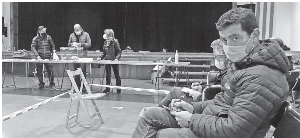
Recompte de vots al local del Cine de l'Estany

Cap a les vuit i vint, Esquerra Republicana de Catalunya agafava la davantera del recompte i ja no cedia aquesta posició fins al final. Com a tot el país, la baixada