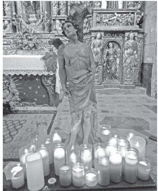
Sant Sebastià, a Oló

Malgrat que en la dècada dels anys cinquanta l'ajuntament la declarés festa local, sempre ha tingut un caràcter pròpiament religiós. Hi ha hagut alguns intents