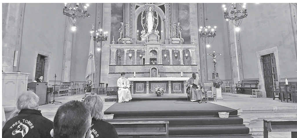
Ofici de Sant Antoni

És d'agrair la inventiva de tots plegats per no sucumbir a la desídia a què ens vol arrossegar el maleït virus.