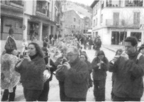
La rua de l'Escola Pia (24 de febrer)

Així, el divendres dia 24 de febrer a la tarda els alumnes de l'Escola Pia van fer una rua pels carrers de la vila, animats amb la música dels Grallers de Mojà.