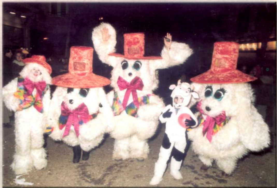
Curiós grup de comparses en la rua de Carnestoltes (4 de març)