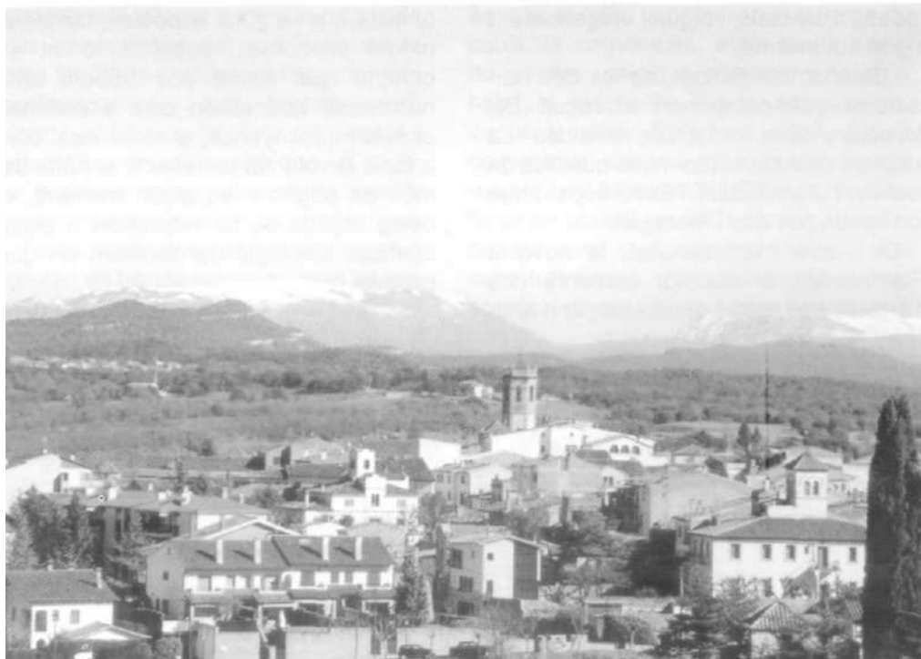
Panoràmica de Castellterçol amb el Montseny al fons

capella de Sant Francesc, capella ben conservada que hi ha al mig del poble, i pel carrer de Sant Francesc, amunt, amunt, cap al coll de la Creueta. Un cop allà dalt vam continuar pujant en direcció nord, cap al tallafocs que han fet recentment des del mirador d'en Garròs fins a Pedrós. La vista des d'aquest punt s'escampa per totes bandes i es pot contemplar un magnífic paisatge en totes direccions: per una banda es veu el Montseny amb el Pla de la Calma, Tagamanent...; més a prop, el castell de la Popa, el pla de Castellcir; als nostres peus, Castellterçol i la plana moianesa, i més lluny, el Pirineu, aquests dies ple de neu; girant a