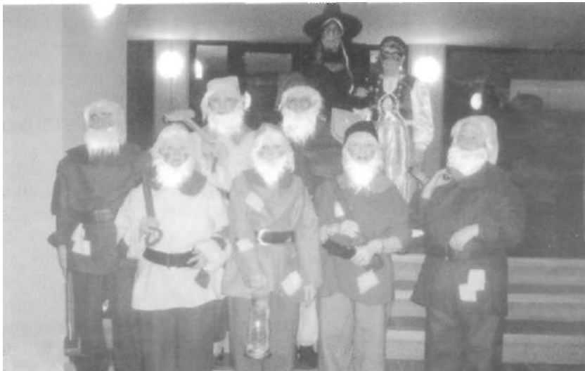
Disfresses del ball de carnestoltes (26 de febrer)

Diumenge dia 26, a la mateixa hora, concert de la Coral de Gent Gran de Sant Vicenç de Castellet. Sorteig d'una toia.