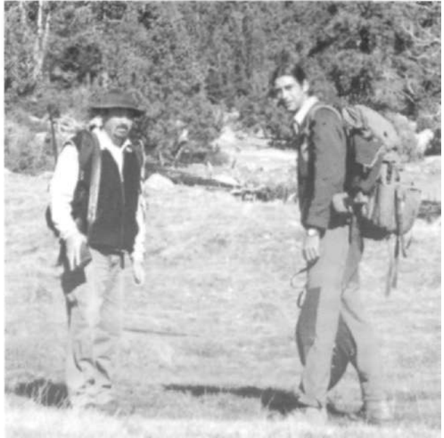
Vila amb un altre caçador

—Normalment una jornada de caça comença a la sortida del sol i la primera raó d'això és que no es pot caçar sense llum, fins al punt d'arribar també d'hora i poder fer un esmorzar al bosc. Generalment, abans de les nou del matí ja hem esmorzat. Avui en dia això es valora molt, perquè, si es caça en grup, és una cosa que crea germanor. Llavors continuem la jornada, tant en caça major com menor, fins que les condicions obliguen a acabar o fins que estàs cansat. Per exemple, si vas a empaitar perdus a les dotze del migdia, ja pots haver fet un