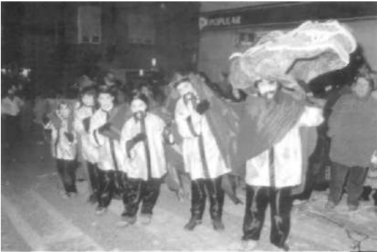
Dos grups de comparses de carnestoltes (4 de març)

Per acabar-ho d'arrodonir, l'Ateneu va organitzar un ball de carnestoltes a les onze de la nit.