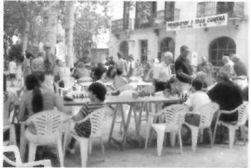
Torneig d'Escacs (13 agost)

El diumenge dia 13 d'agost es va fer durant tot el matí per carrers i places la Festa de la Bandereta a benefici de la Creu Roja. També, a partir de les nou del matí, al Club de Golf de Montbrú, el Trofeu Vila de Moià, modalitat «scramble». I encara, a partir de les deu, al parc, el III Torneig Joan Codina d'Escacs, amb partides ràpides.