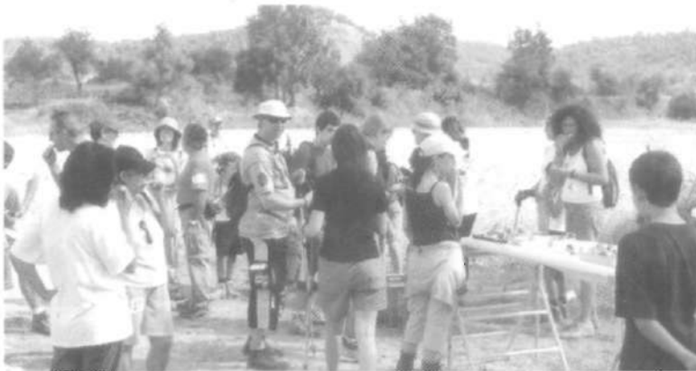
Punt d'avituallament de la Caminada Popular (6 agost)

El diumenge dia 6 d'agost a les vuit del matí va partir puntualment la XXVI Caminada Popular pel Moianès, organitzada pel GEMI. El recorregut tenia uns 14 km i arribà, com a punt més llunyà, a Vilarjoan.