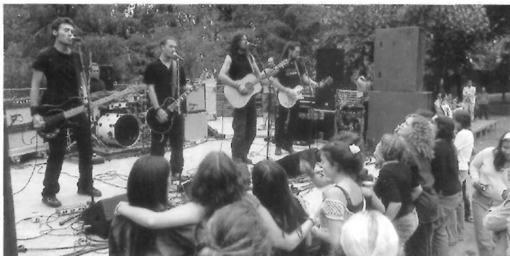
Actuació del grup de rock (17 agost)

El tercer dia de la festa major comptà encara amb dos actes més: a les onze de la nit, pas de la Xaranga Galagongos pels carrers; a dos quarts de dotze, ball de fi de festa major a l'envelat, amb l'orquestra De Noche, Pastorets Rock i DJ Caganer.