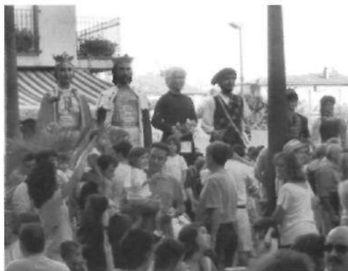
Cercavilla dels gegants (29 juliol)

El dissabte dia 29 de juliol a la tarda es va fer la XXIV Trobada Gegantera, organitzada per la Colla de Geganers de Moià, amb colles convidades procedents de Barcelona (barri del Pi), les Borges