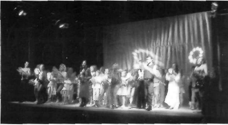
Salutació final dels artistes del Musical (13 agost)