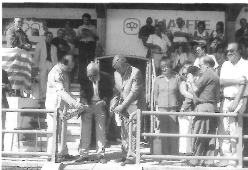
Inauguració de les millores al camp de futbol (27 agost)

El diumenge dia 27 d'agost a les onze del matí les autoritats locals i comarcals van inaugurar la gespa artificial i altres millores (canalització de l'aigua pluvial, que s'aprofitarà per a remullar la gespa, pavimentació de superfícies al voltant del camp, canvi de les butaques, instal·lació d'un marcador electrònic, etc.) al camp de futbol del CE Moià. A continuació van actuar els gegants i els grallers. Després foren presentats els equips de futbol base (pre-benjamí, benjamí, aleví, infantil, cadet, juvenil, tercera regional i segona regional), que feren partits d'exhibició. Durant tot el matí es