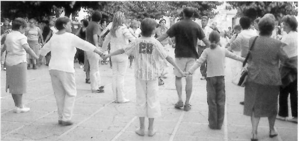
Ballada de sardanes a la plaça de Sant Sebastià (13 agost)

A les cinc de la tarda, al Saiol, començava el 3r Campionat de Futfanga, seguit d'una exhibició de motocròs. A dos quarts de sis de la tarda, el