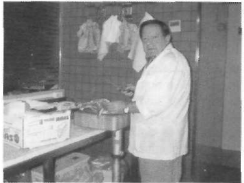
Padrís en el seu obrador de carnisser