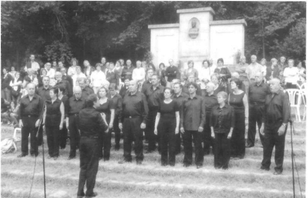
La Coral de Moià actuant en la Festa de l'Arbre Fruiter (17-8-2006)

Històricament, el cant coral ha estat en el nostre país un referent en el conreu dels valors socials i la reivindicació patriòtica. Des del regeneracionisme impulsat pels cors de Clavé a mitjan segle XIX fins a la resistència cultural duta a terme durant el franquisme, el cant coral ha tingut sempre un important