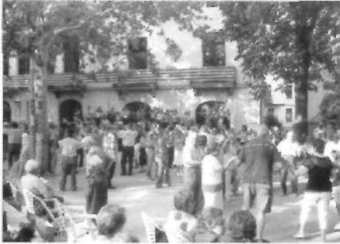
Aspecte de l'Aplec de la Sardana (6 agost)

El mateix diumenge, a partir de dos quarts de cinc de la tarda, tingué lloc al parc municipal el 7è Aplec de la Sardana, organitzat per la secció Sardanes del Casal de Moià. Hi intervingueren tres cobles: Vila d'Olesa, Sant Jordi (Ciutat de Barcelona) i Ciutat de Cornellà. S'interpretaren un total de setze sardanes, dues d'elles, de conjunt.