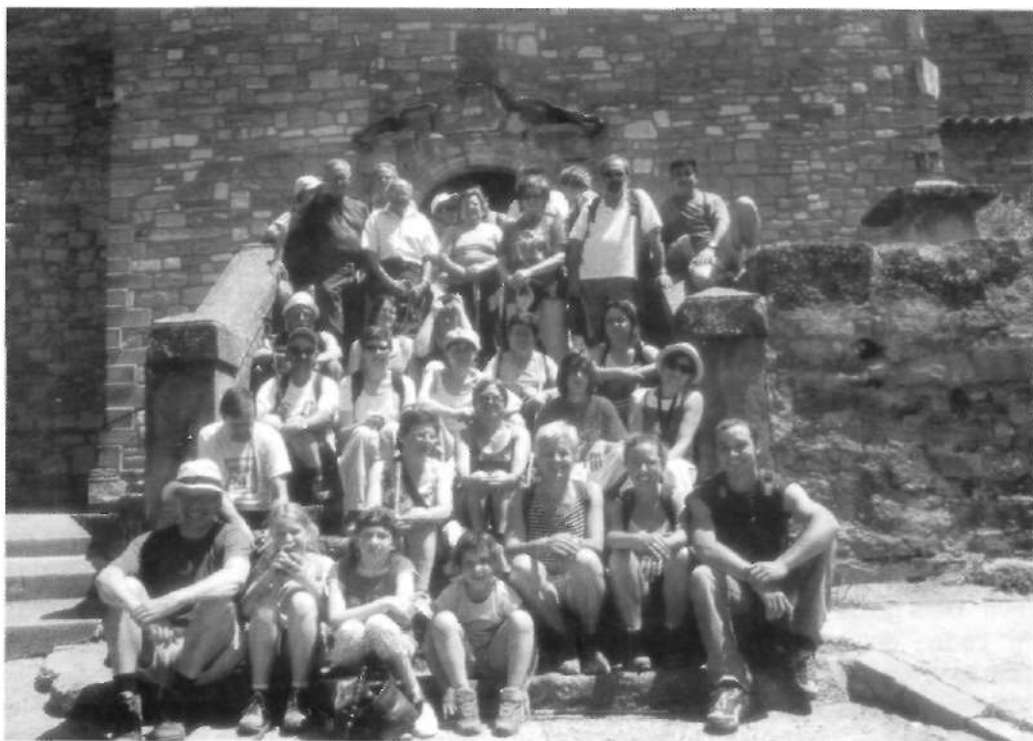
Els caminaires a Santa Maria d'Oló