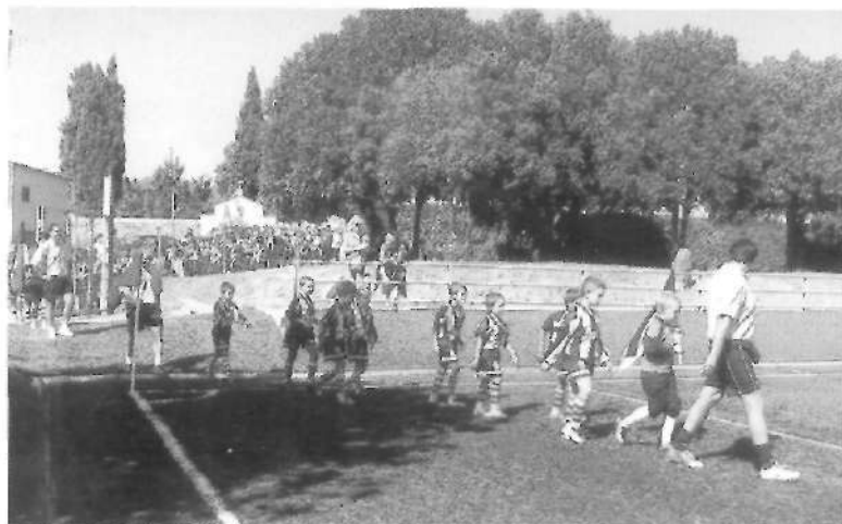
Presentació dels equips (27 agost)