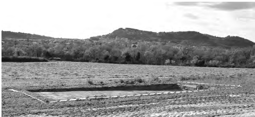
Detall de les obres al PSFV El Prat de la Plana