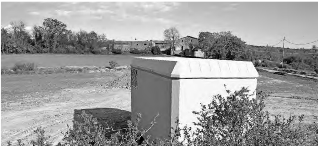
Obres al PSFV El Prat de la Plana

En l'àmbit solar, es preveu que 47,2 MW es puguin instal·lar en cobertes d'edificis, 7,6 MW en espais artificialitzats i 210 MW en altres espais no artificialitzats. Es tracta d'unes xifres d'energia fotovoltaica molt menors en comparació amb les comarques veïnes —segurament degut a l'orografia i a la gran quantitat de superfície protegida inclosa en els PEIN—. La potència requerida és la meitat que la del Lluçanès, de 528 MW, amb una superfície i població molt més petites. Altres comarques limítrofes i properes depassen totes els 1.000 MW: 1.070, el Vallès Oriental; 1.109, Osona; 1.301, el Berguedà; 1.348, el Vallès Oc-