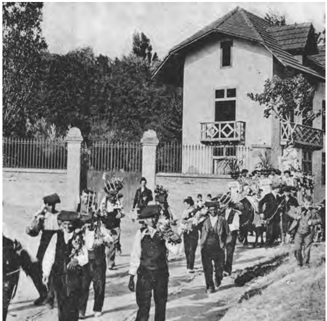
La porta inferior del parc, en 1906, amb les columnes i els capitells; a la dreta, el xalet, casa del servei d'en Coma

L'accessibilitat al parc va començar en iniciar-se la seva activitat pública, les celebracions de la Festa de l'Arbre Fruiter, l'any 1934, i en obrir-se els baixos de la casa com a biblioteca pública, quan s'enderroca un habitatge lateral, ja adquirit