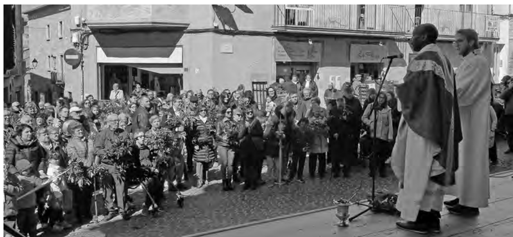
Benedicció de Rams