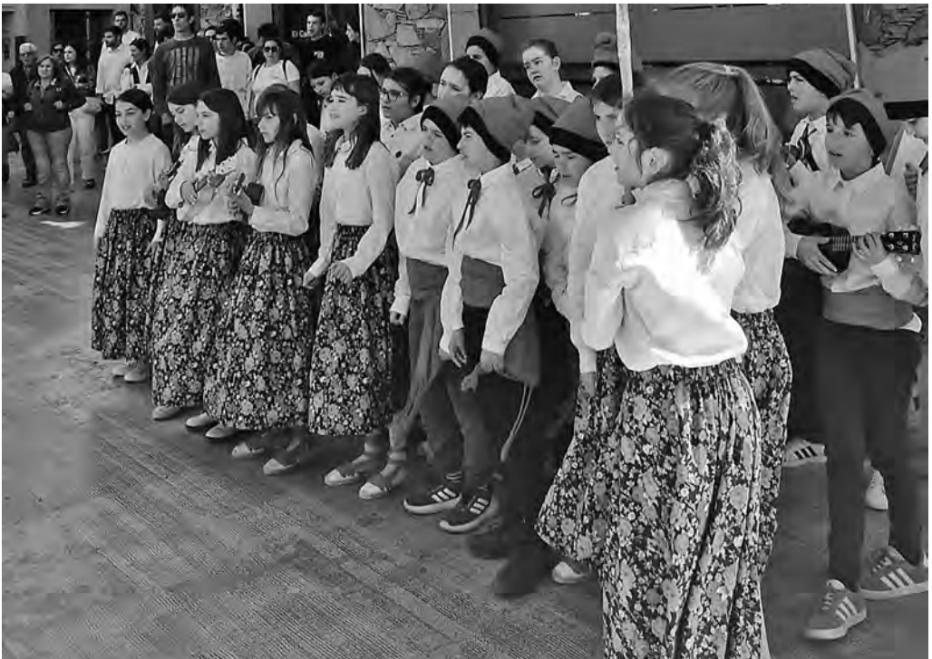
Els Armats. Les caramelles