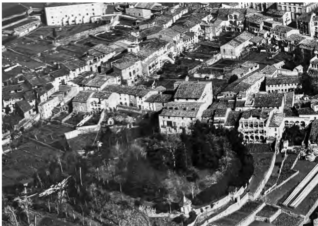
Detall de la part superior del parc, l'any 1929

Per a saber-ne més, podeu visitar https://paisatgeterritori.es/parc-municipal/ .