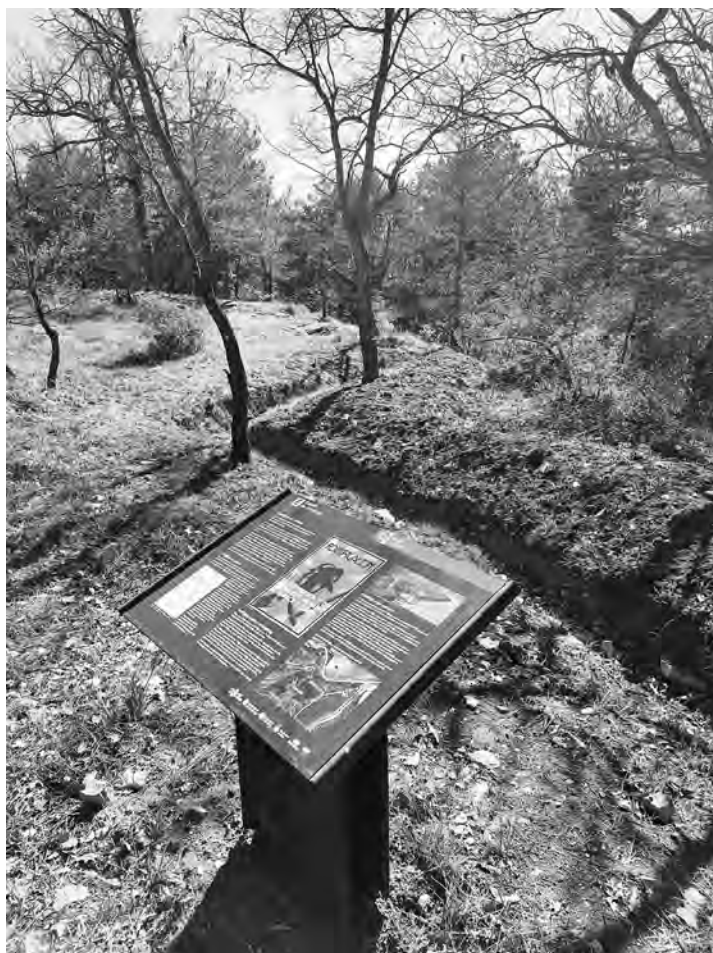
Panell informatiu davant la trinxera

A inicis del segle XXI es pogué aportar un raig d'esperança dins aquest atzucac. L'any 2000 es dugué a terme amb mètodes científics la primera exhumació d'una fossa comuna a l'Estat espanyol. A partir