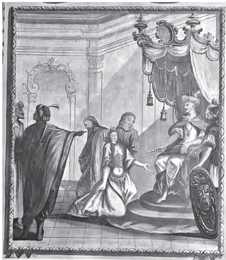
Escena de la història d'Ester on la jove posa en risc la seva vida presentant-se davant del rei sense ser convocada, per convidar-lo a un banquet on demanarà la salvació del poble jueu

Mardoqueu va entrar en rivalitat amb Aman, un alt càrrec de la cort que el veia com un competidor davant els privilegis i favors del rei. Aman, coneixedor de l'origen jueu de Mardoqueu, intentà de convèncer el rei, amb enganys i