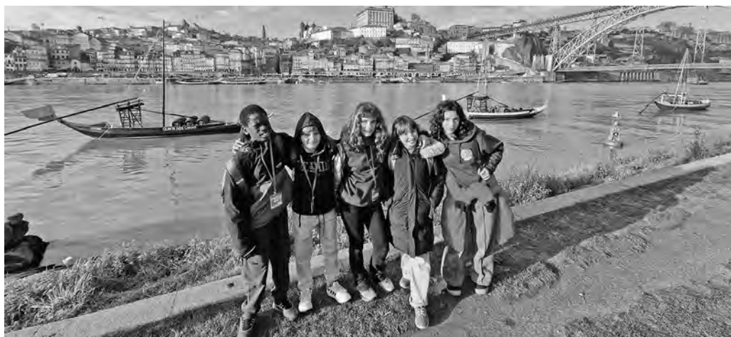
L'alumnat moianès a Porto

Els nostres alumnes també van presentar els mosaics catalans i la figura