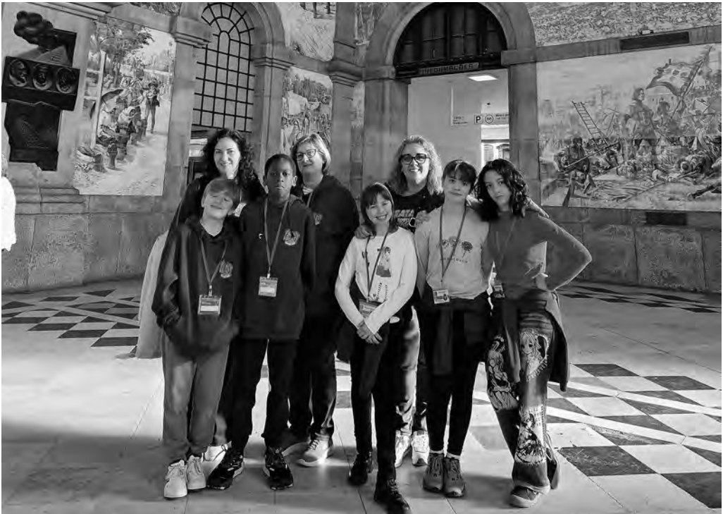
Alumnes i professorat a l'estació de São Bento

d'Antoni Gaudí, i creàrem un trencadís conjunt en parelles internacionals, compartint tècniques, idees i creativitat.