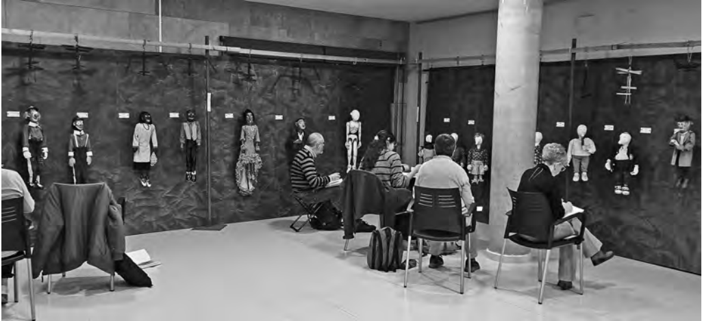
93a dibuixada a Calders, coincidint amb l'Aplec de Titelles

Durant el mes de març el Cercle Artístic del Moianès va mantenir una activitat intensa, combinant trobades de dibuix, exposicions i propostes culturals vinculades a les arts visuals.