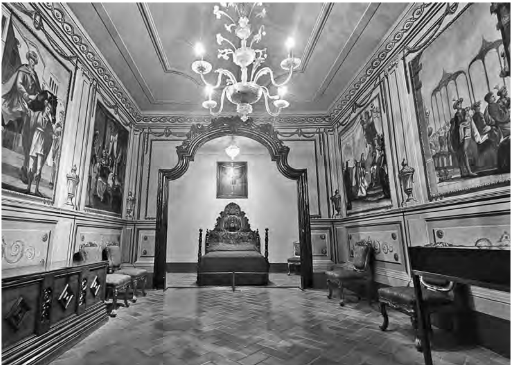
Sala-alcova de la Casa Museu Rafel Casanova

hi havia un flux constant de gent —els amos, els avis, fills, tietes, oncles, mossos, minyones, i forans amb qui es feien negocis i tractes comercials—, la sala-alcova constituïa un espai privat on l'amo i la mestressa es podien reunir sense el destorb d'altres membres de la casa. En aquella època, era costum decorar aquestes cambres amb pintures de temàtica mitològica o religiosa en les quals es reflectís una certa opulència figurativa, com palaus, columnes o robes sumptuoses. És el cas de la història d'Ester, el motiu escollit pel matrimoni Casanova per a decorar aquesta estança.