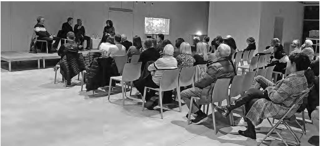
Aspecte del hall de Cal Comadran durant la presentació