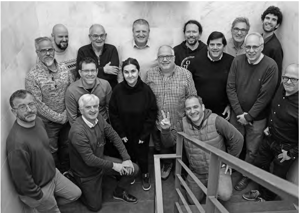
Fot. Sebastià Renom