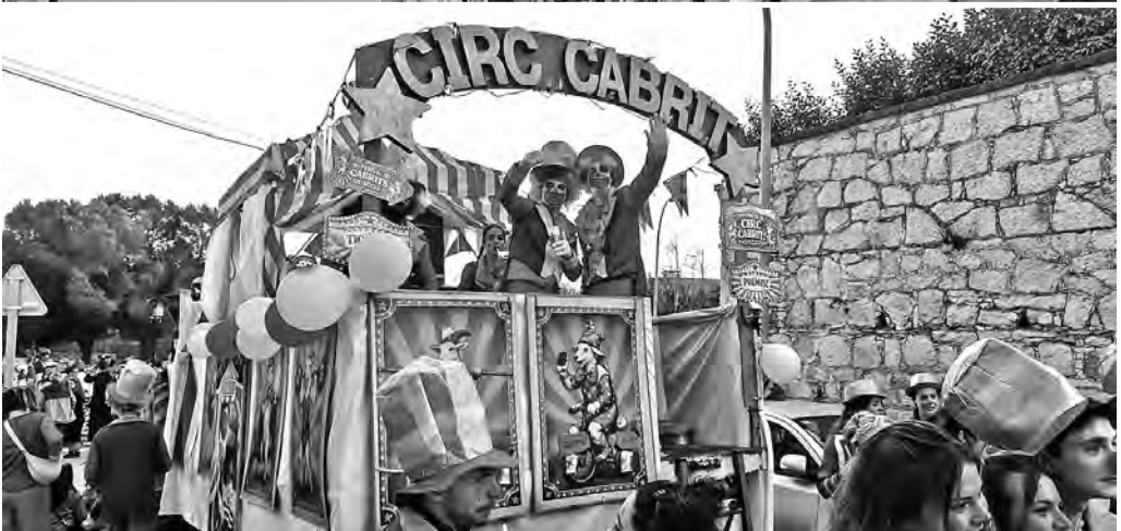
Rampoina Obrera, Dos membres del jurat, i Circ Cabrit