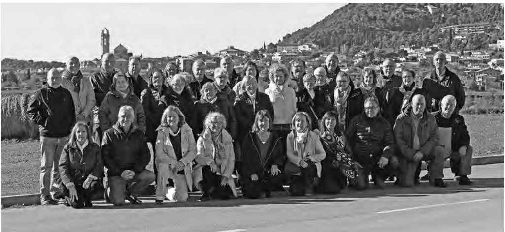
Trobada dels setantins

Agraïm la dedicació dels qui tan encertadament organitzaren la trobada.