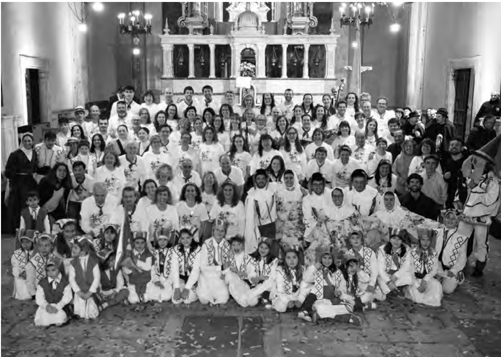
El conjunt dels dansaires, al final de la celebració

La resposta per part dels dansaires i del públic que ens ve a veure fidelment a cada ballada ens mostra que la cultura a Moià, i en concret les danses tradicionals, són més vives que mai. Moltes gràcies a tothom! Fins a la pròxima ballada!