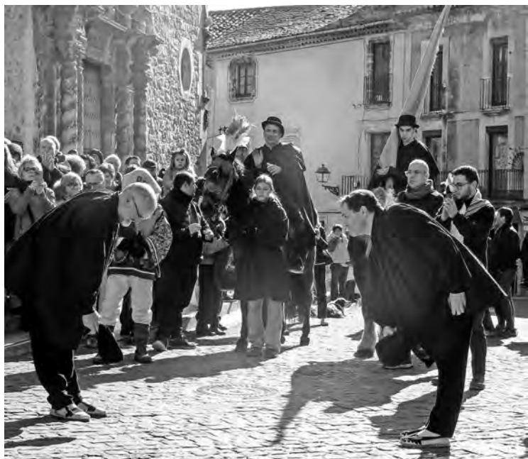
Els balladors del Contrapàs Curt, davant el banderer