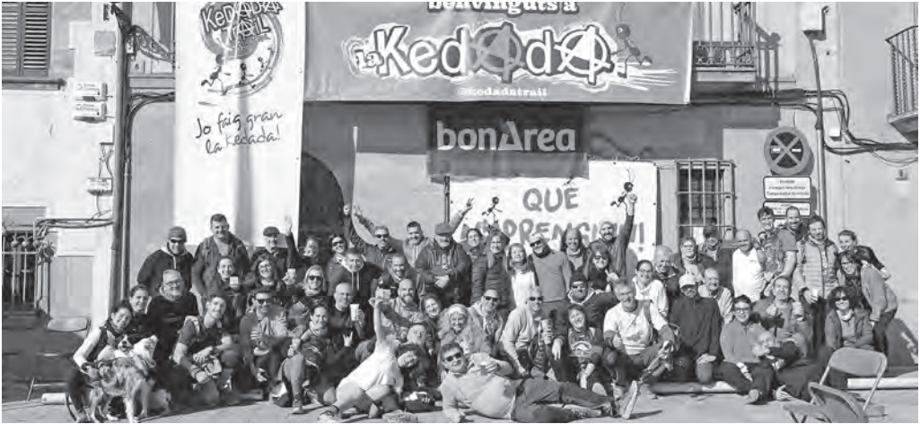
Grup de voluntaris de la Kedada Trail

Darrerament s'han produït dos esdeveniments solidaris a benefici de Càritas Parroquial de Moià.