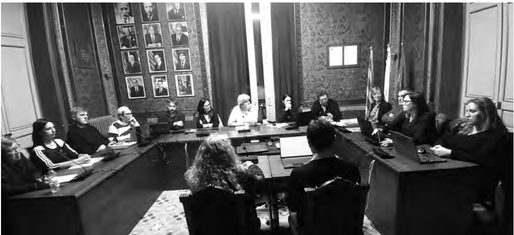
Ple municipal del 28 de gener

L'alcalde va respondre dient que el grup Aramoià no se sentia interpel·lat per la moció, si bé la consulta i els seus resultats havien significat «diferents tocs d'atenció». Va declarar que els tràmits administratius no es poden suspendre i que la regularització del polígon era un punt de trobada entre tots els grups. El debat, en què intervingueren tots els re-