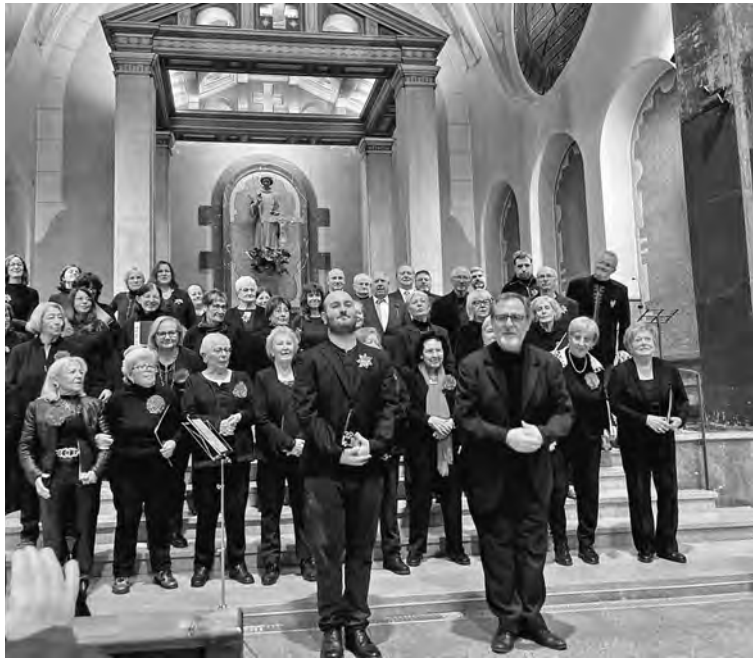
Actuació conjunta a Mollet

La formació treballa per projectes trimestrals, un format que facilita la incorporació de nous cantaires al llarg del curs. El projecte actual es basa