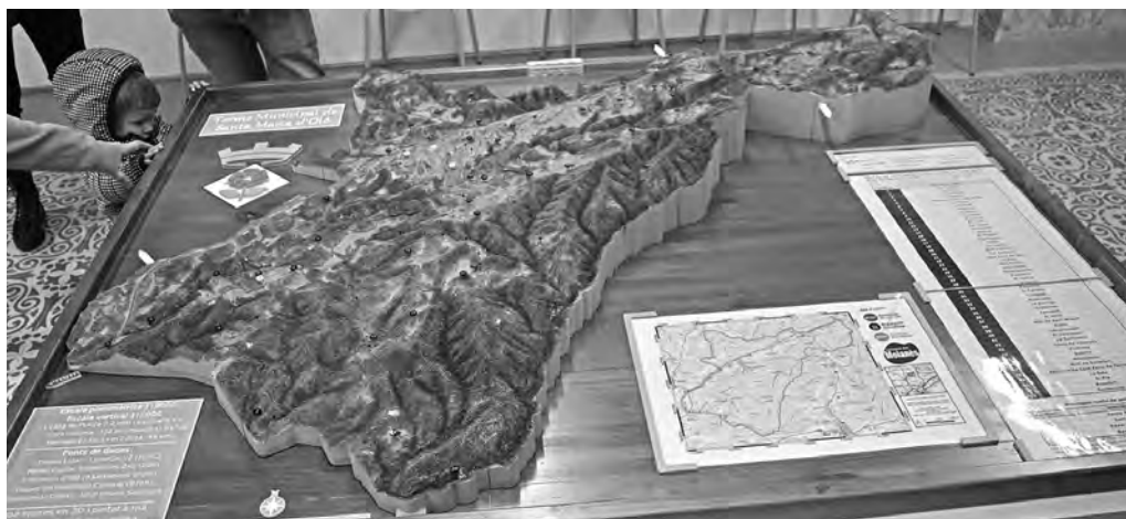
La maqueta, el dia de la seva presentació

La presentació es va fer al Centre Recreatiu davant un centenar d'assistents. A través d'un PowerPoint, l'autor va explicar pas a pas la seva construcció i la quantitat d'hores esmerçades, més de cinc-centes només en la feina d'impressió. Ha tingut el suport del portal Barcelona és molt més , la Diputació de Barcelona, Paisatges Barcelona i el Consorci del Moianès. A partir d'ara es podrà veure a l'entrada de l'Ajuntament d'Oló.