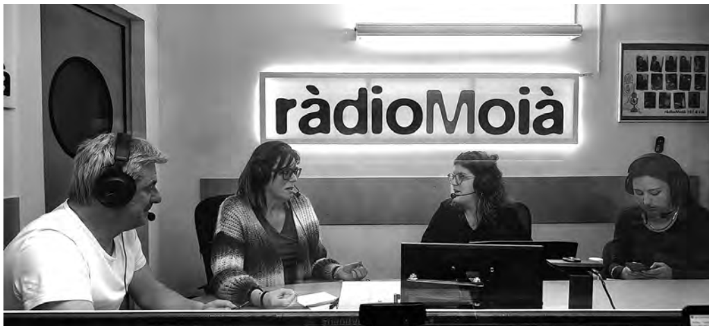
Tertúlia política, el 6 de febrer

Durant els mesos de gener i febrer Ràdio Moià ha continuat amb els programes habituals de la seva graella, mantenint el compromís amb la informació local, la cultura i la participació ciutadana.