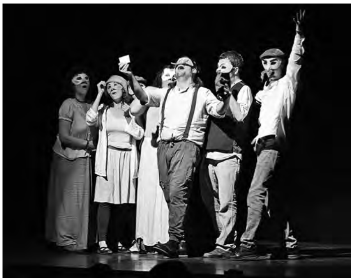
«Spoilers», espectacle presentat a la II Mostra de Teatre del Moianès

Des de setembre del 2023 el Grup de Teatre per a Adults El Remolí Teatre forma part de la vida cultural del Moianès. Les classes van començar a Can Remolí, punt de partença d'un projecte que va néixer amb la voluntat d'oferir un espai de creativitat, expressió i cohesió per a gent adulta amb inquietuds artístiques i que, des d'aleshores, no ha parat de créixer.