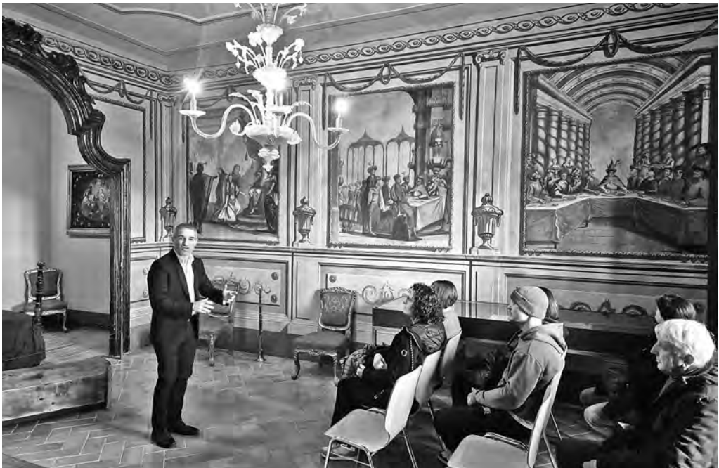
El Poema de Nadal, a l'alcova de Can Casanova

En l'àmbit de la divulgació ambiental, el museu ha organitzat l'activitat «Descobrim la biodiversitat del Parc Prehistòric de les Coves del Toll», amb la col·laboració de GAIA - Serveis Ambientals. Aquesta proposta gratuïta ha permès als participants de conèixer la riquesa natural de l'entorn a través d'un itinerari guiat, observant fauna, flora i rastres d'animals i valorant la importància de la conservació del medi natural.