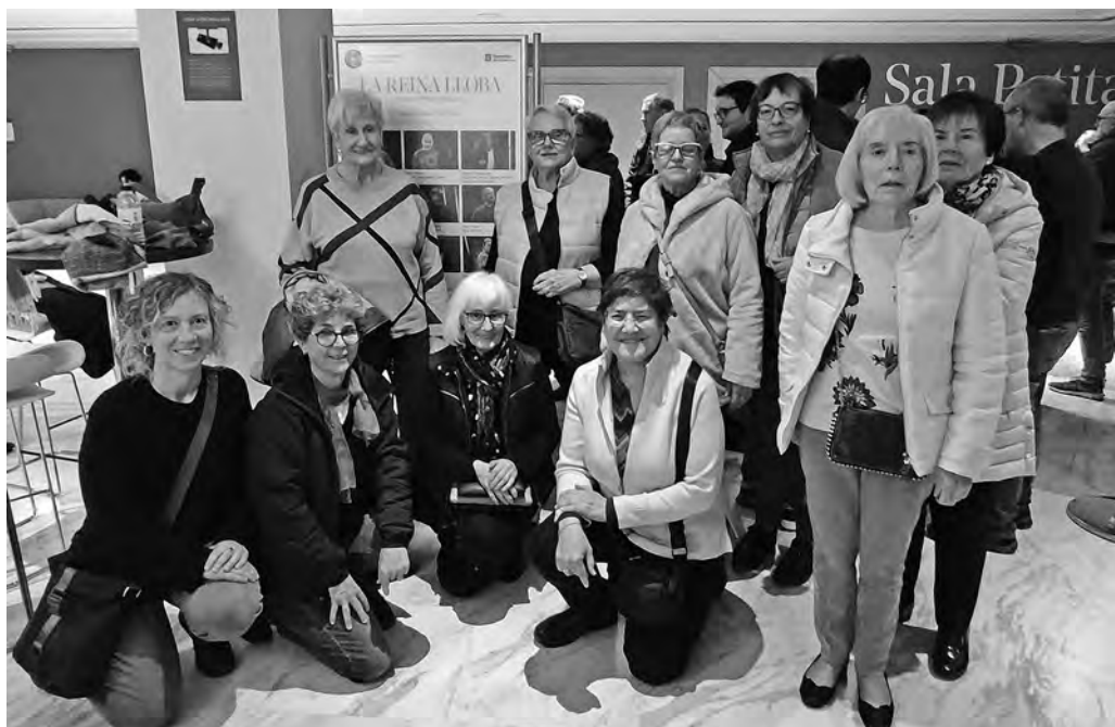
Sortida al Teatre Nacional de Catalunya

El 28 de gener, Shelley Theodore va guiar una altra sessió del Book Club amb la novel·la The Vegetarian , de la Premi Nobel de Literatura Han Kang.