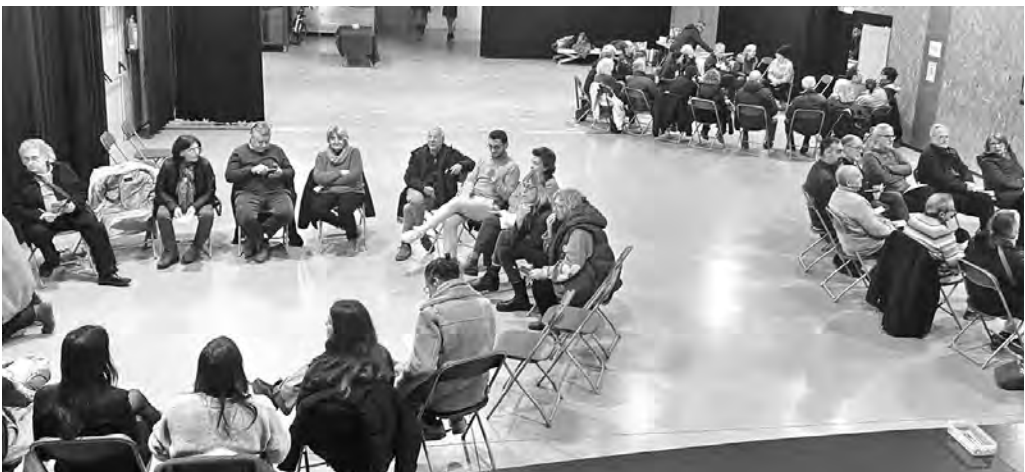
«Ideant propostes de forma col·lectiva per fer efectiu el resultat de la consulta»

Un nombre molt gran de moianesos i moianeses, més dels que van donar el vot a Aramojà, s'ha pronunciat clarament contra aquest projecte, i això hauria de fer reflexionar l'equip de govern.