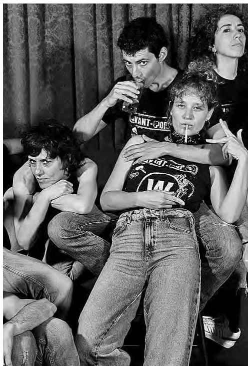
Balart amb algunes actrius del Watusi