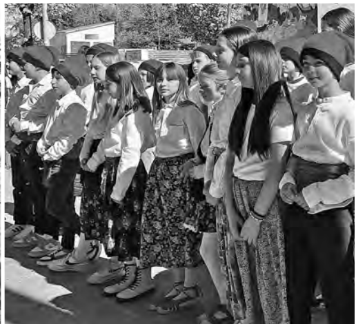
Caramellaires dels anys 1948 i 2025