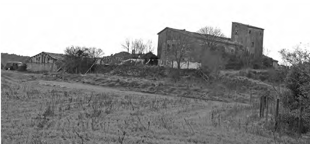
La Païssa, a Monistrol de Calders

L'alcalde es compromet a donar les màximes facilitats als qui aportin idees per a millorar el projecte del cementiri. Ara bé, estar en contra de tot no serveix per a res i és una falta d'atenció al poble. La plataforma es diu «Així no», però després hi afegeixen «ni així ni de cap manera». Amb els qui no canviaran pas gens ni mica el seu pensament no cal entrar-hi en discussió, creu, i aquesta és l'actitud que manté.